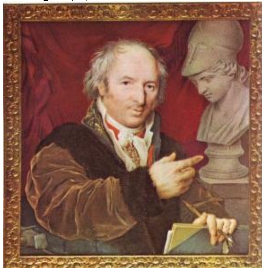
Иван Петрович Мартос ( 1754 1754 — 1835 )