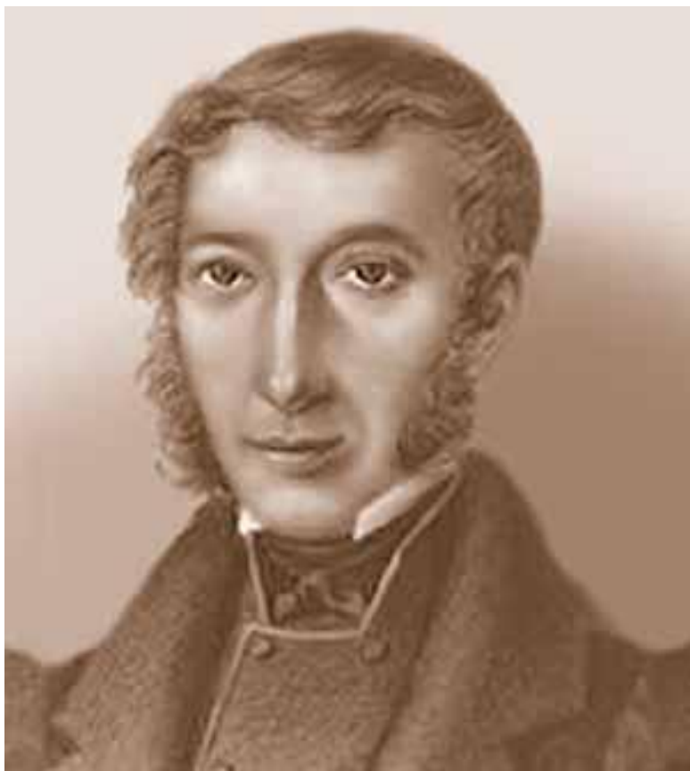
Иван Иванович Теребенёв ( 21 мая (21 мая 1780 — 28 января 1815