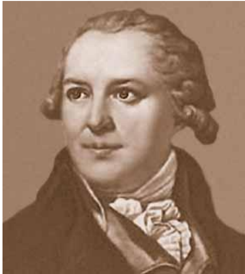
Федот Иванович Шубин ( 28 мая 28 мая 1740 28 мая 1740 — 24 мая 28 мая 1740 — 24 мая 1805 )