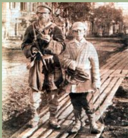
Крестьяне в городе. Конец XIX-начало XX вв.