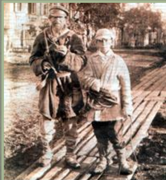
Крестьяне в городе. Конец XIX-начало XX вв.

Основой сельского хозяйства после реформы оставались помещичьи и крестьянские хозяйства. В первые годы после реформы в сельском хозяйстве происходил спад производства. Почему?