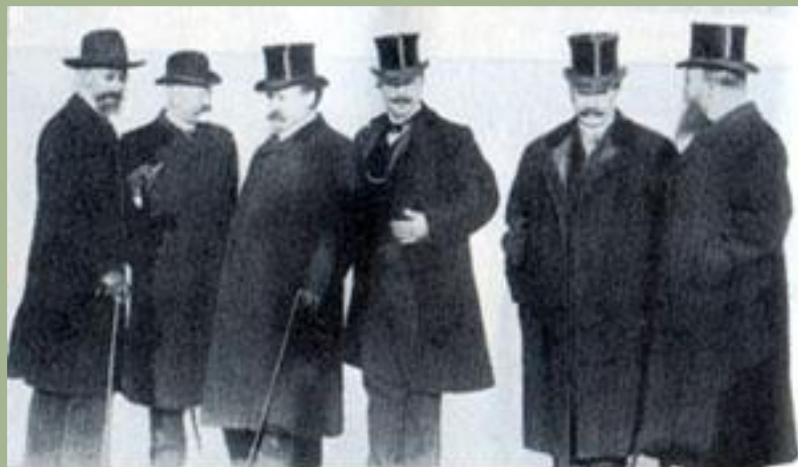
Представители московского делового мира