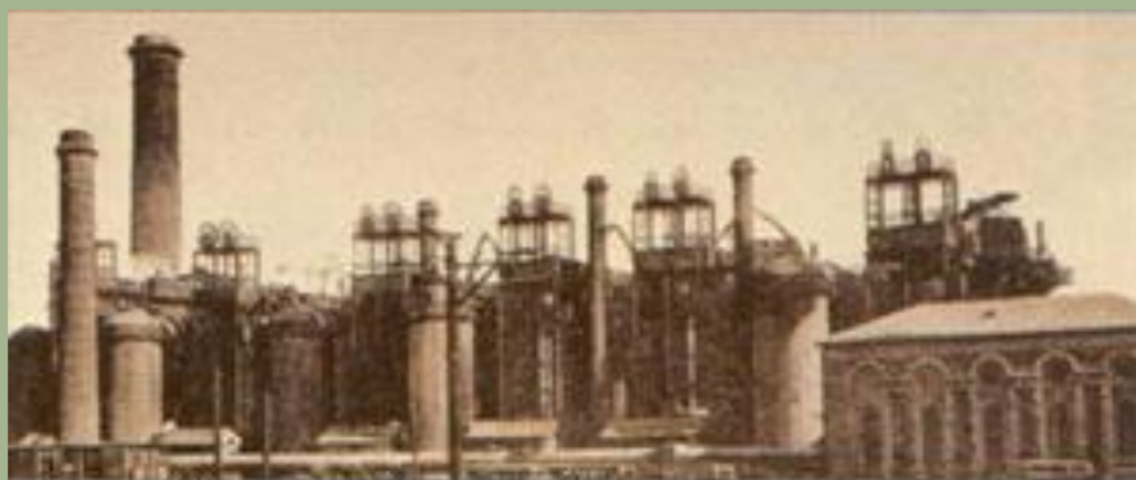
Завод Новороссийского общества каменноугольного, железодельного и рельсового производств в Юзовке

К строительству железных дорог с помощью льгот и премий привлекали частных лиц и иностранный капитал ( концессии ). Особенно поощрялось строительство дорог, связанных с военными нуждами.