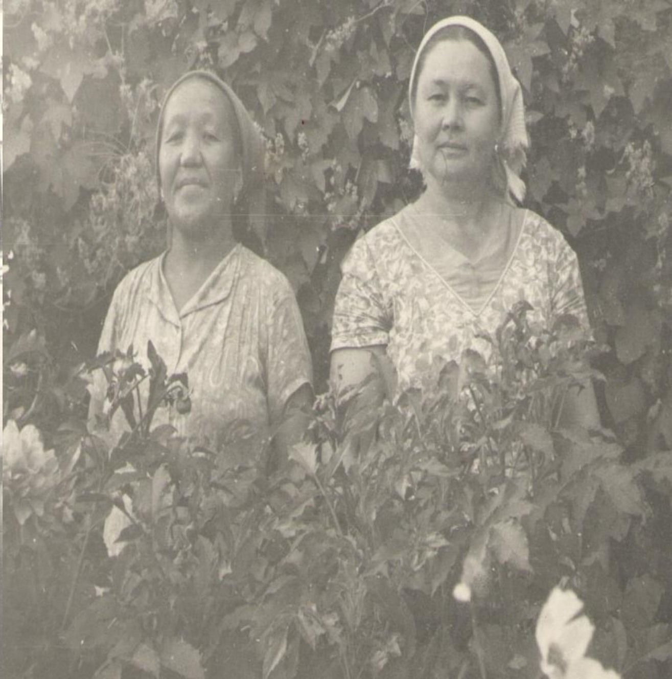
Лучшие подруги матери. Рудник «Боко» (пос. Юбилейный)