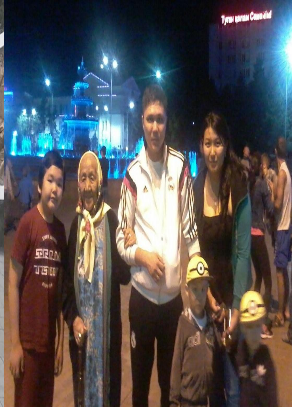
На территории Боевого музея техники и вооружения, а также на центральной площади в г. Семее. Мать на отдыхе с внуком и правнуками.