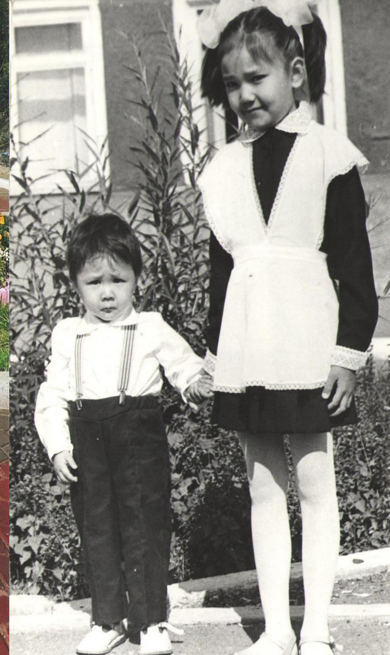
Младшая сестра Багдат 1961г.р. – работает на производстве