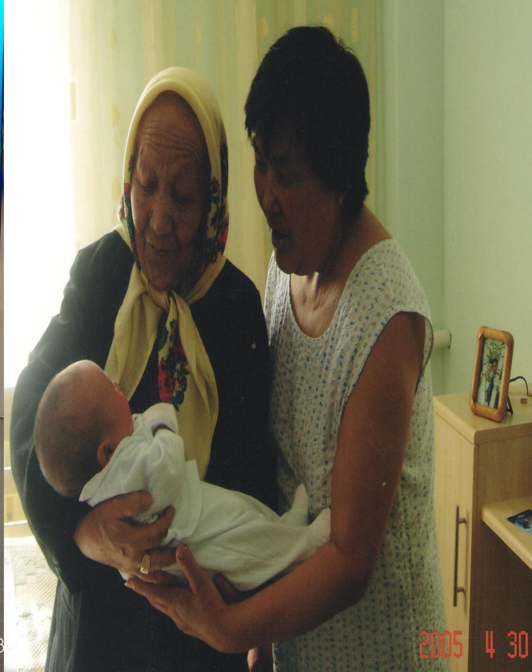
Старший правнук Амир