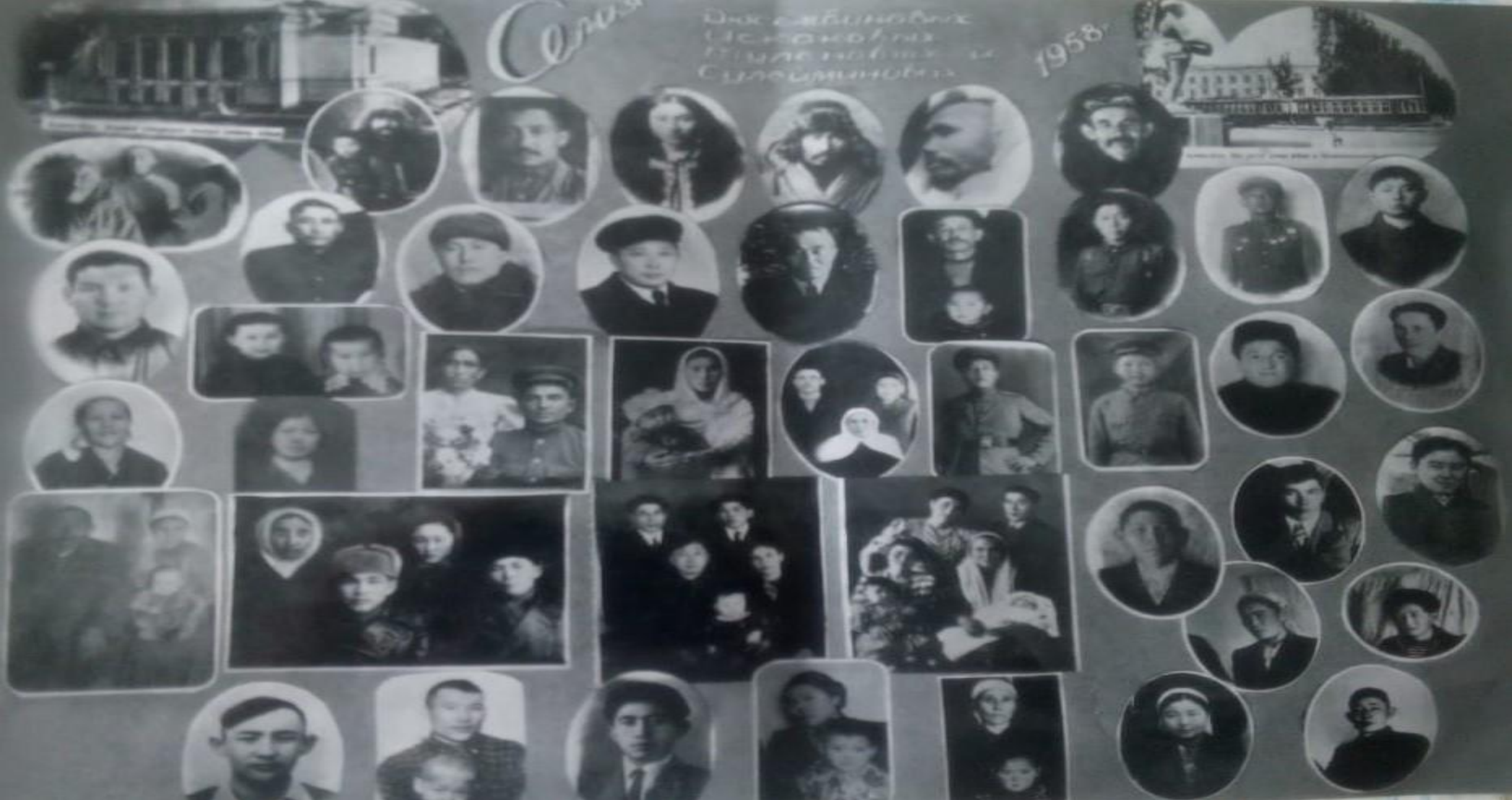
Семейство и родословная моих родителей