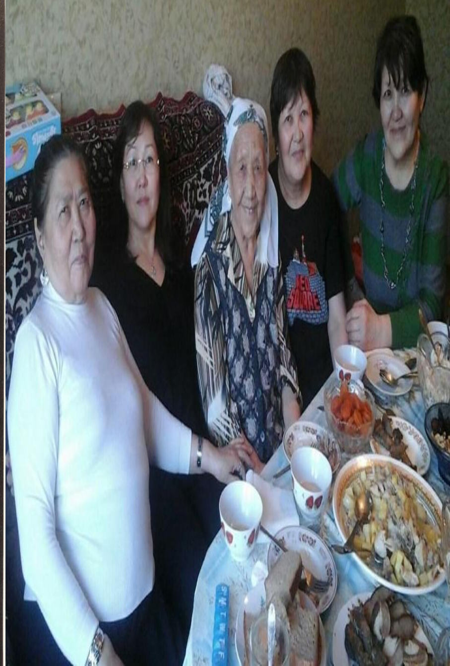
Старшая сестра Баян 1956 г.р.-на пенсий