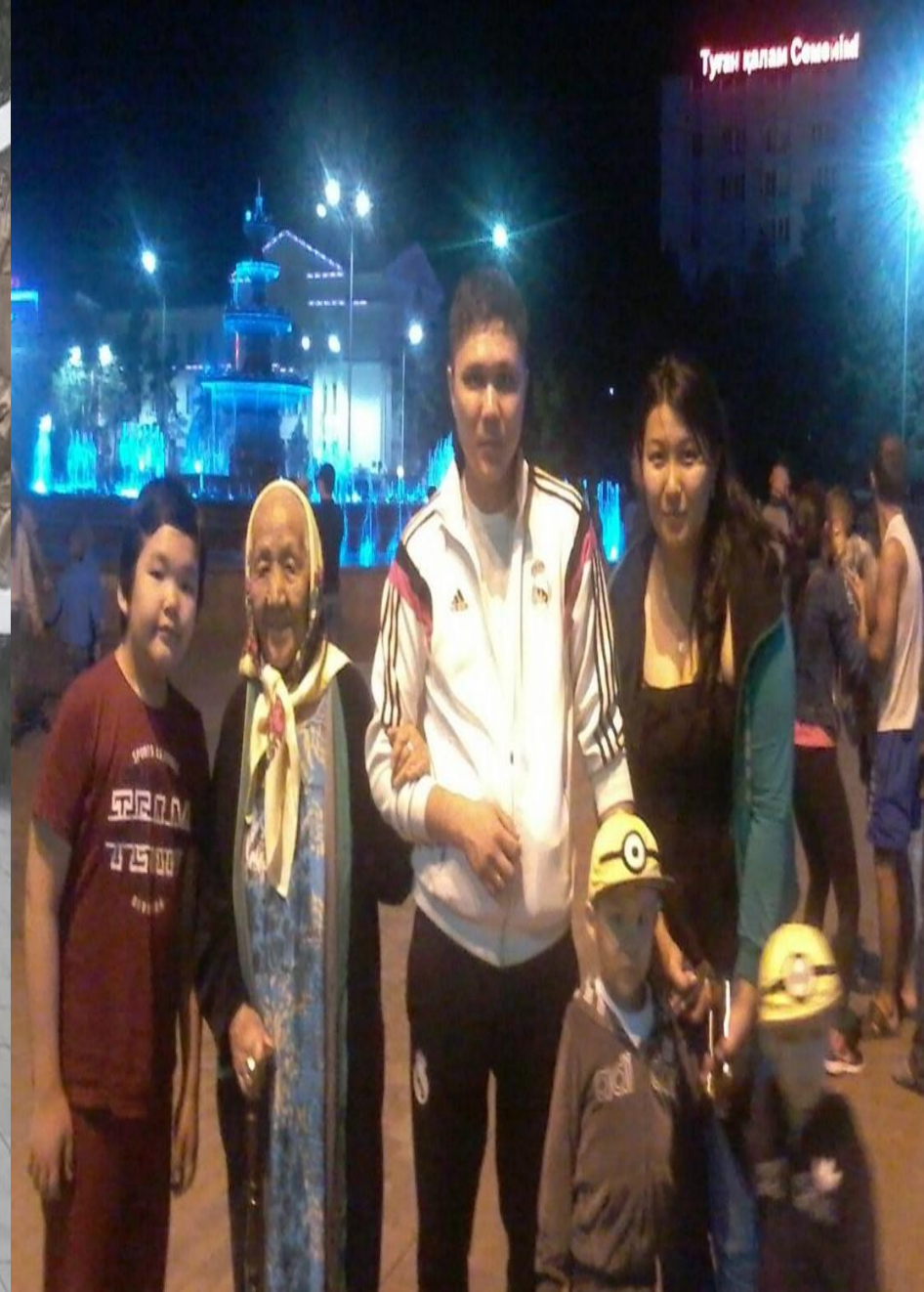
На территории Боевого музея техники и вооружения, а также на центральной площади в г. Семее. Мать на отдыхе с внуком и правнуками.