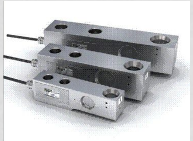
Рис. 3.3 Тензодатчики