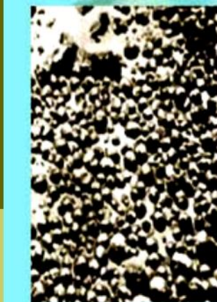
Подводная фотография покрова железо-марганцевых конкреций на дне Тихого океана (глубина 5400м)