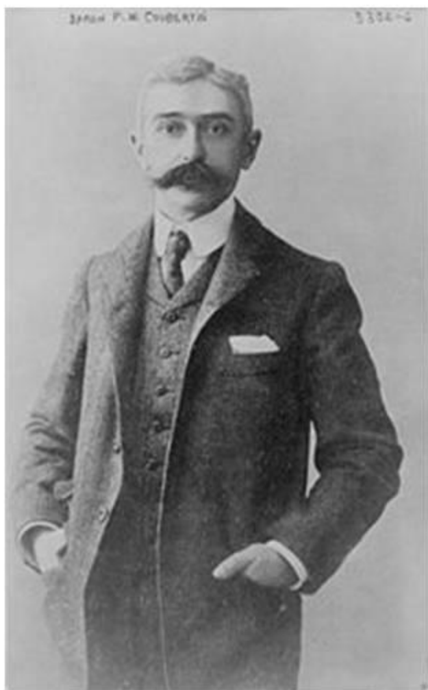
Барон Пьер де Кубертен

Олимпийские игры — крупнейшие международные комплексные спортивные соревнования , которые проводятся каждые четыре года. Традиция, существовавшая в Древней Греции , была возрождена в конце XIX века французским общественным деятелем Пьером де Кубертенем .