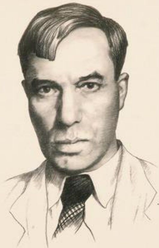
Борис Леонидович Пастернак 1890—1960