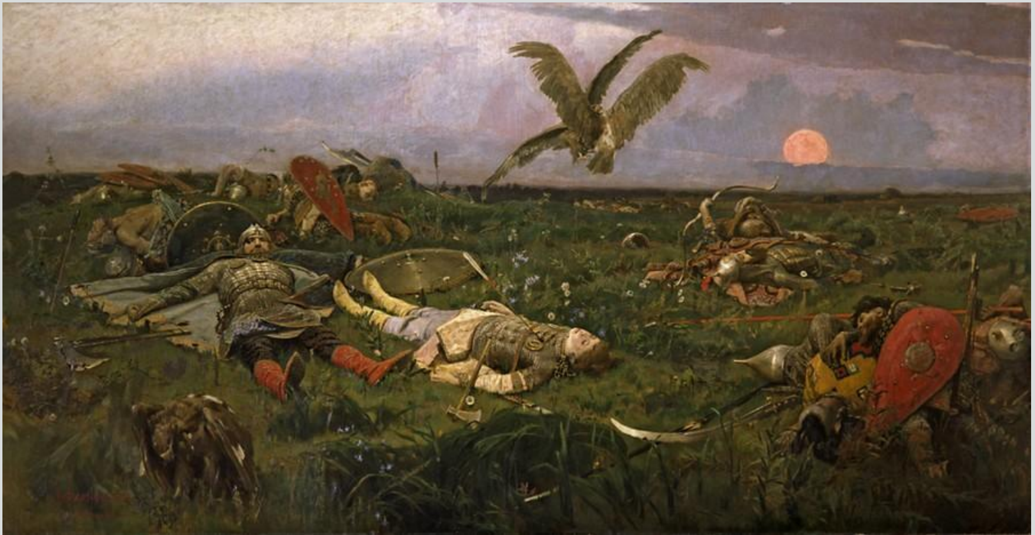
В. Васнецов, «После Игорева побоища»