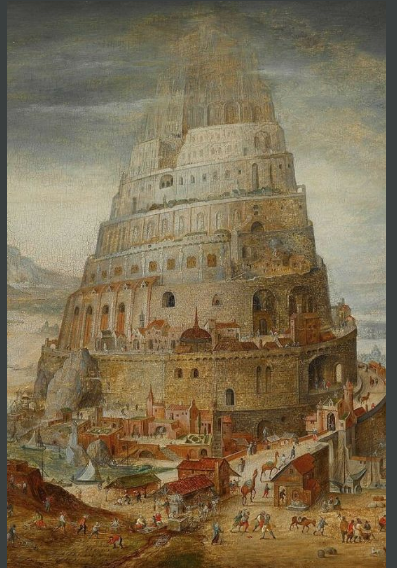
1) В. Серов, «Портрет Ермоловой»; 2) А. Саврасов, «Грачи прилетели»; 3) Абель Гриммер, фрагмент картины «Вавилонская башня»