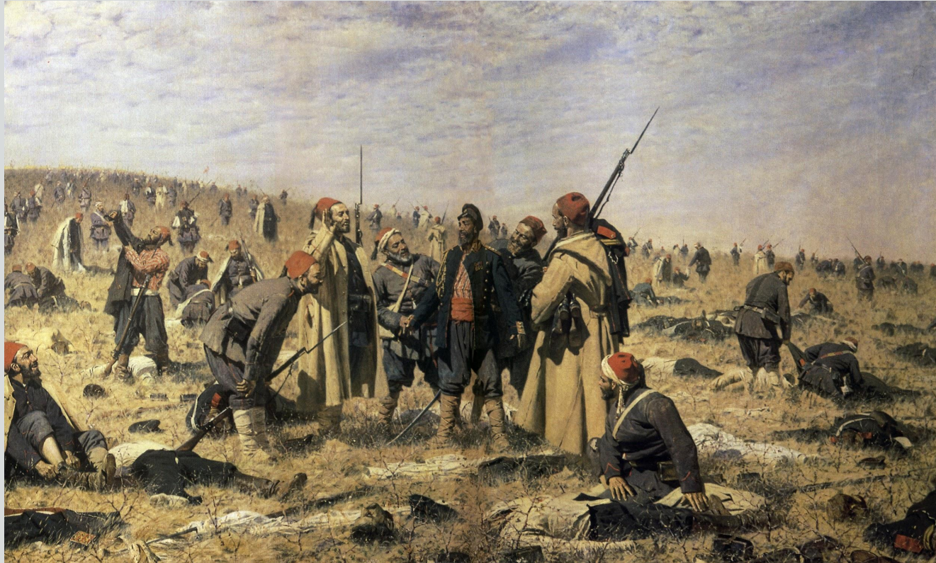
В. Верещагин, «Победители»

Использование горизонталей и вертикалей в композиции, их положение и направление играют огромную роль в том, как мы воспринимаем образ с картины.