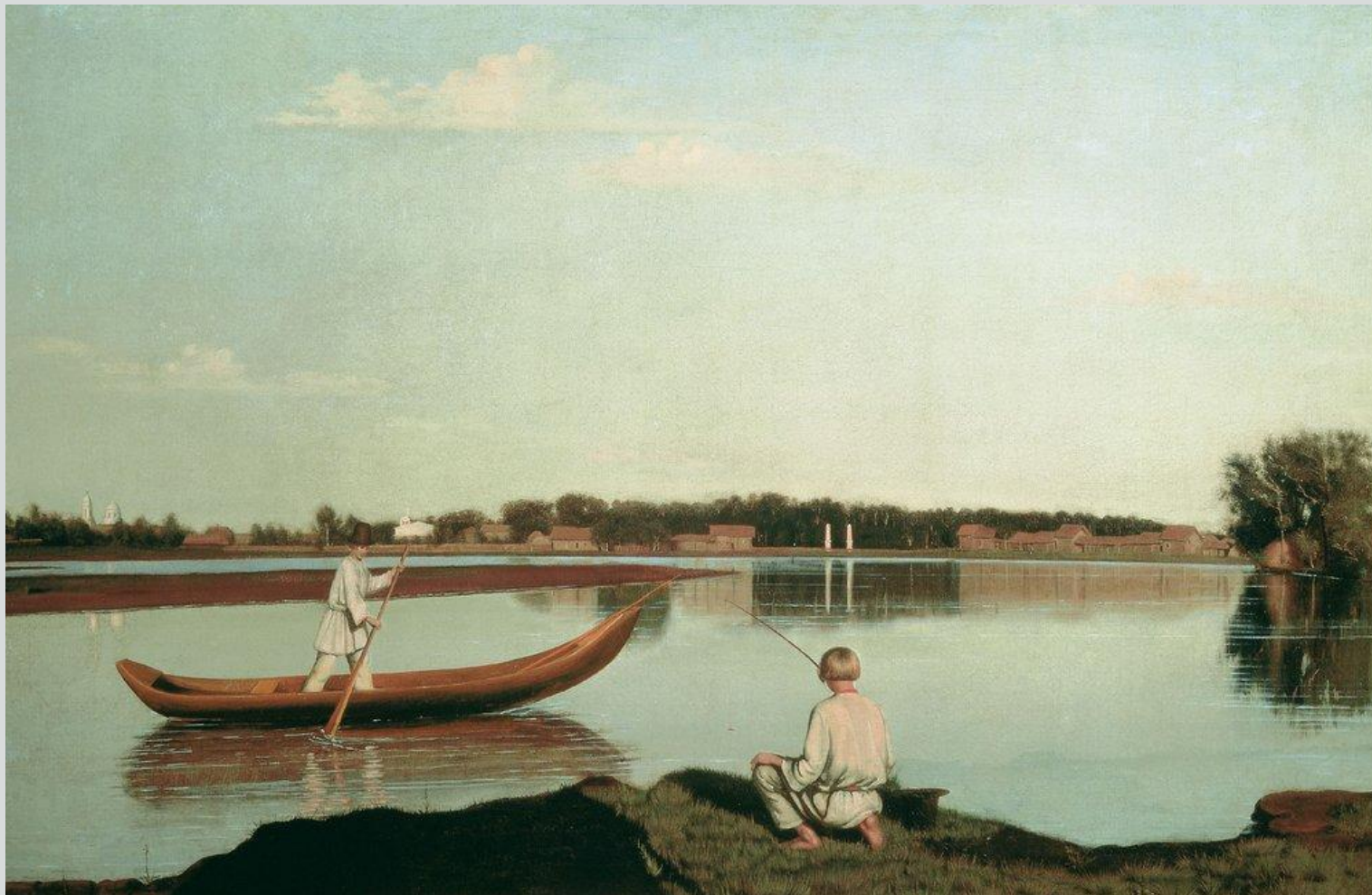
Г. Сорока, «Рыбаки»

Приём горизонталей даёт возможность передать состояние относительного покоя и тишины, статичность либо движение мимо зрителя.