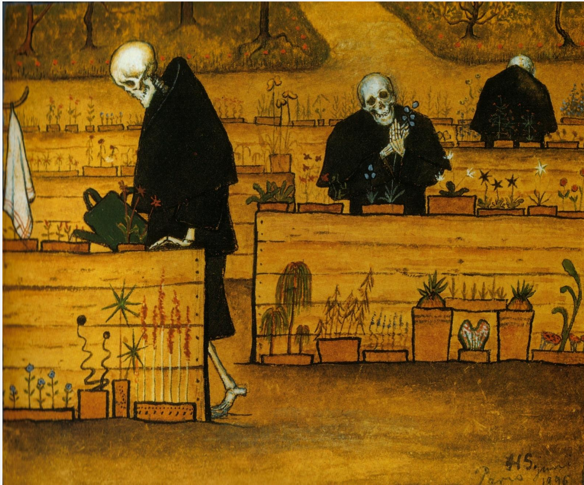
Хуго Симберг, "Сад смерти"

Рисунок может выстраиваться на сочетании вертикальных и горизонтальных объектов (или направлений). Главное чтобы они были уравновешены. Чтобы не получилось так, что в рисунке одни вертикали или наоборот.