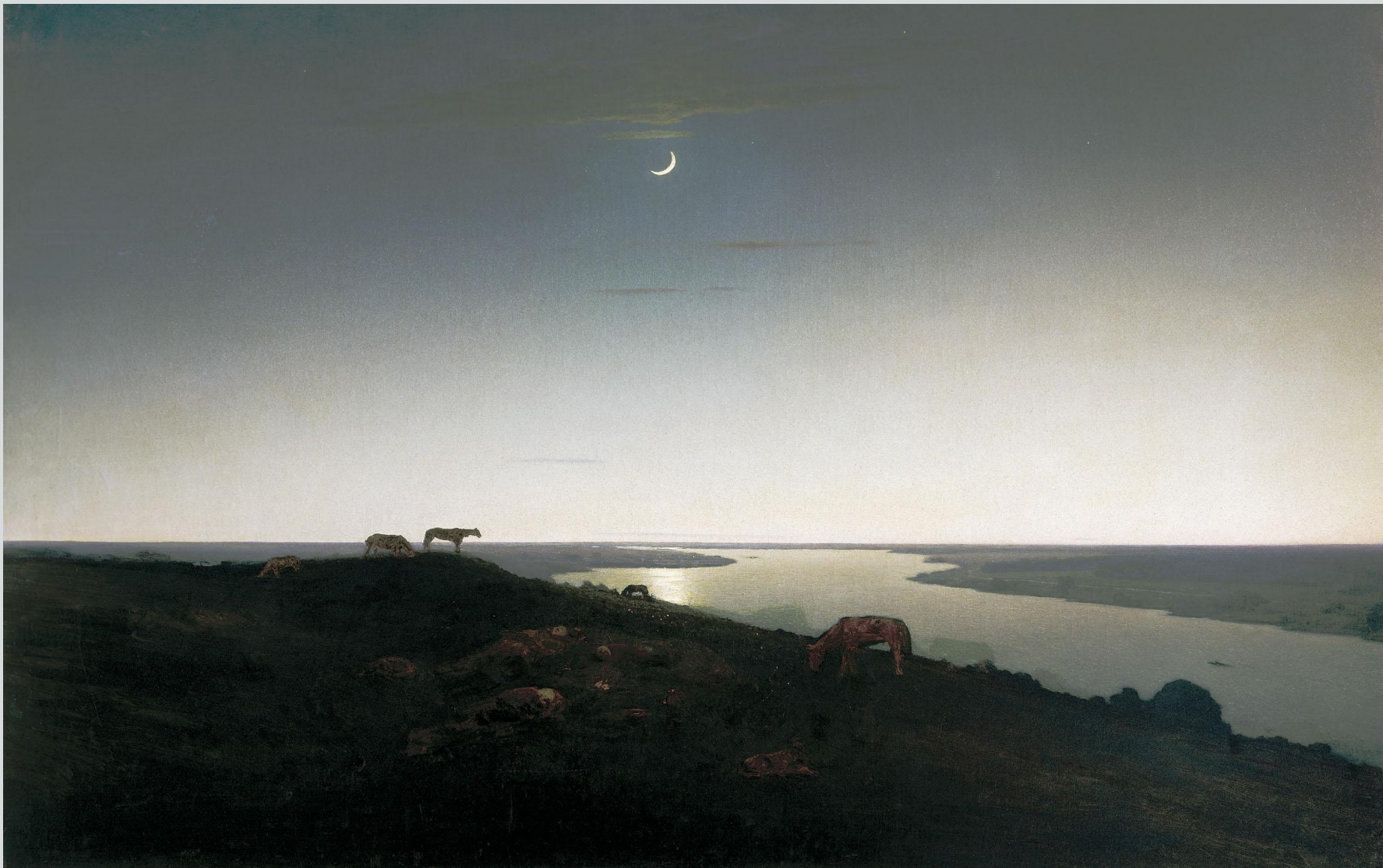
А. Куинджи, «Ночное»