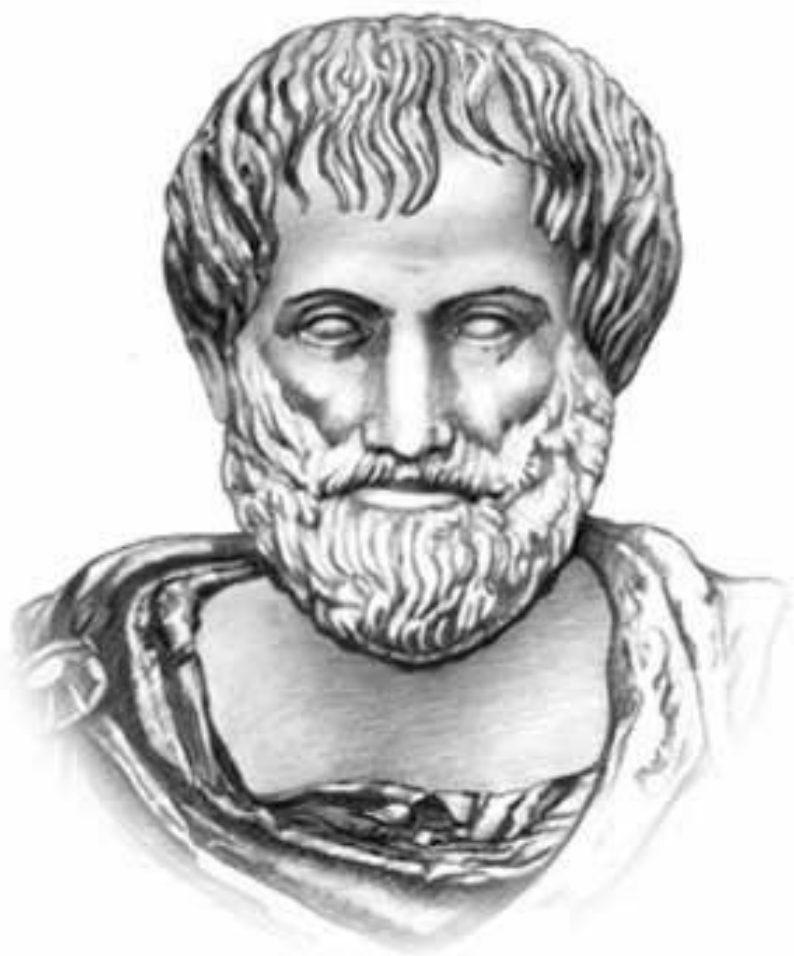
АРИСТОТЕЛЬ 384-322 до н. э.