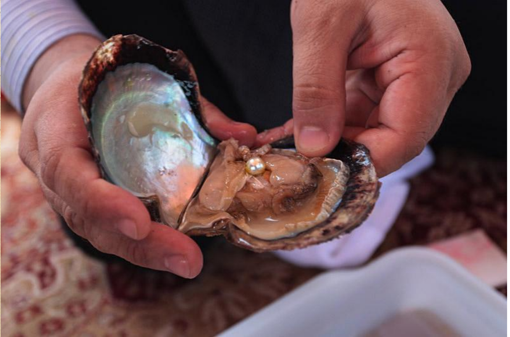
Фото моллюска европейской жемчужницы