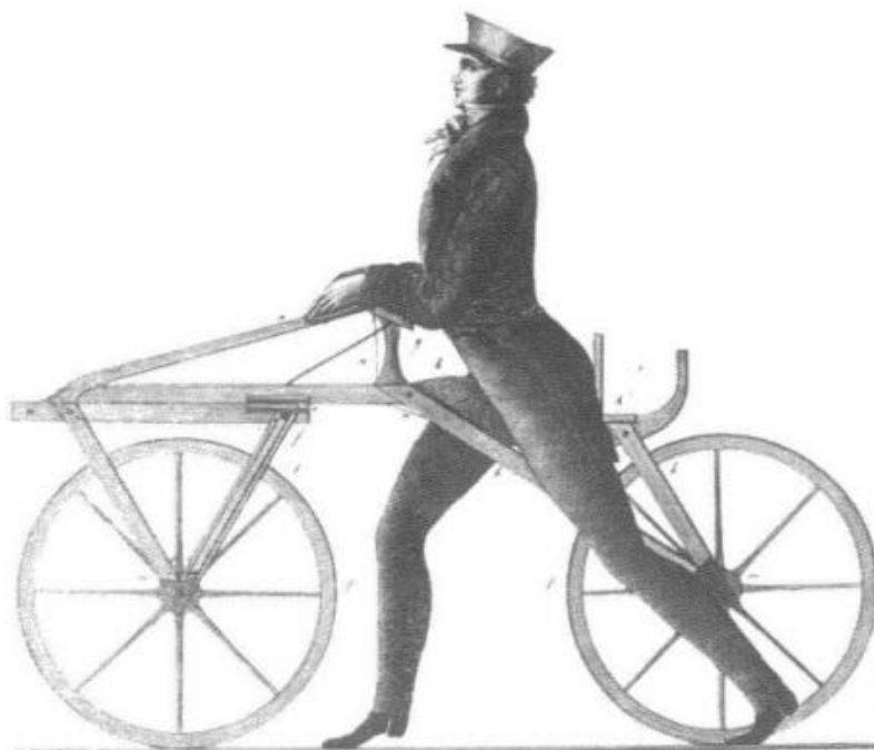
Laufmaschine des Freiherrn von Drais (erfunden 1817)

ПЕРВЫМ УСТРОЙСТВО, ПОХОЖЕЕ НА ВЕЛОСИПЕД, СОЗДАЛ В 1817-М ГОДУ НЕМЕЦКИЙ ПРОФЕССОР БАРОН КАРЛ ФОН ДРЕЗ.