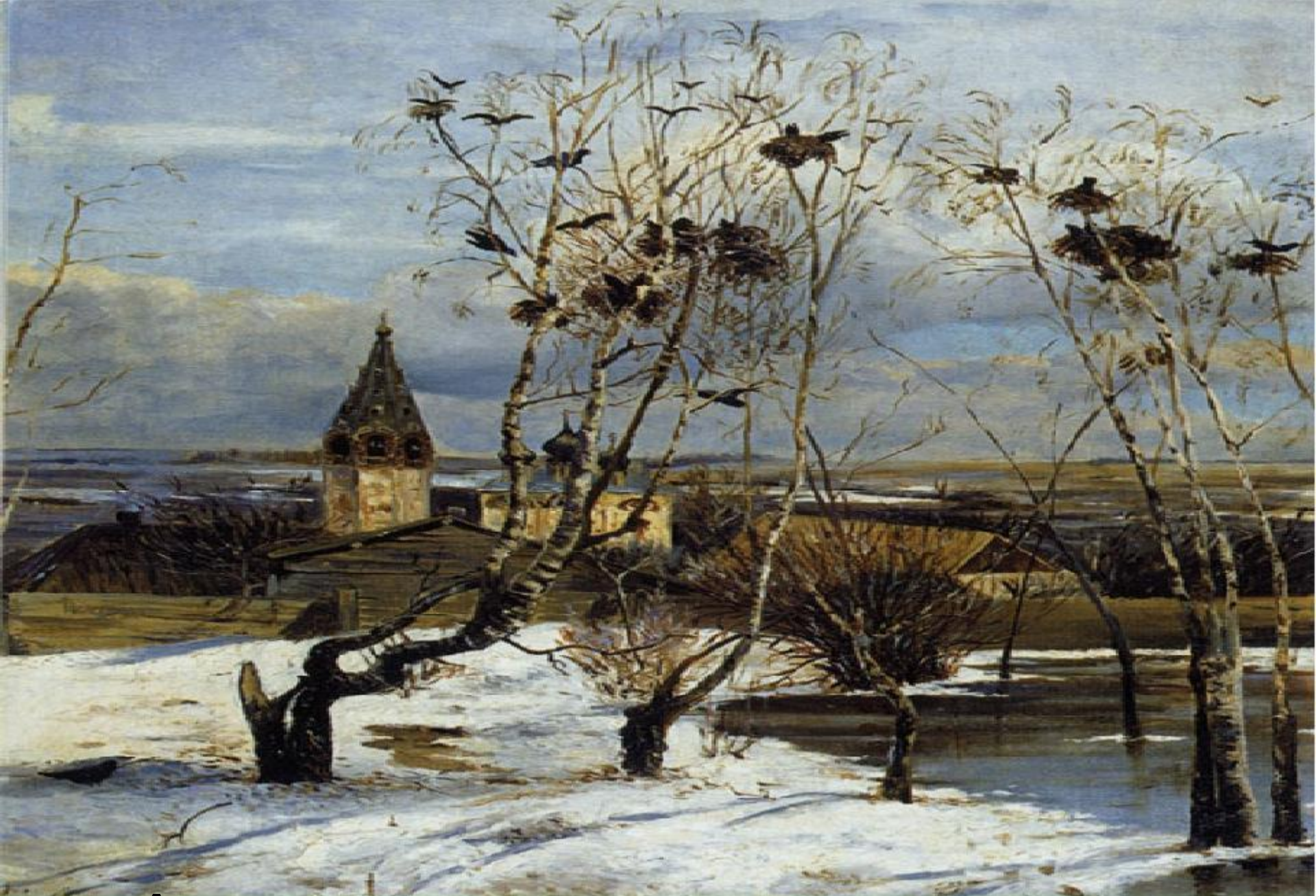
Алексей Саврасов «Грачи прилетели»