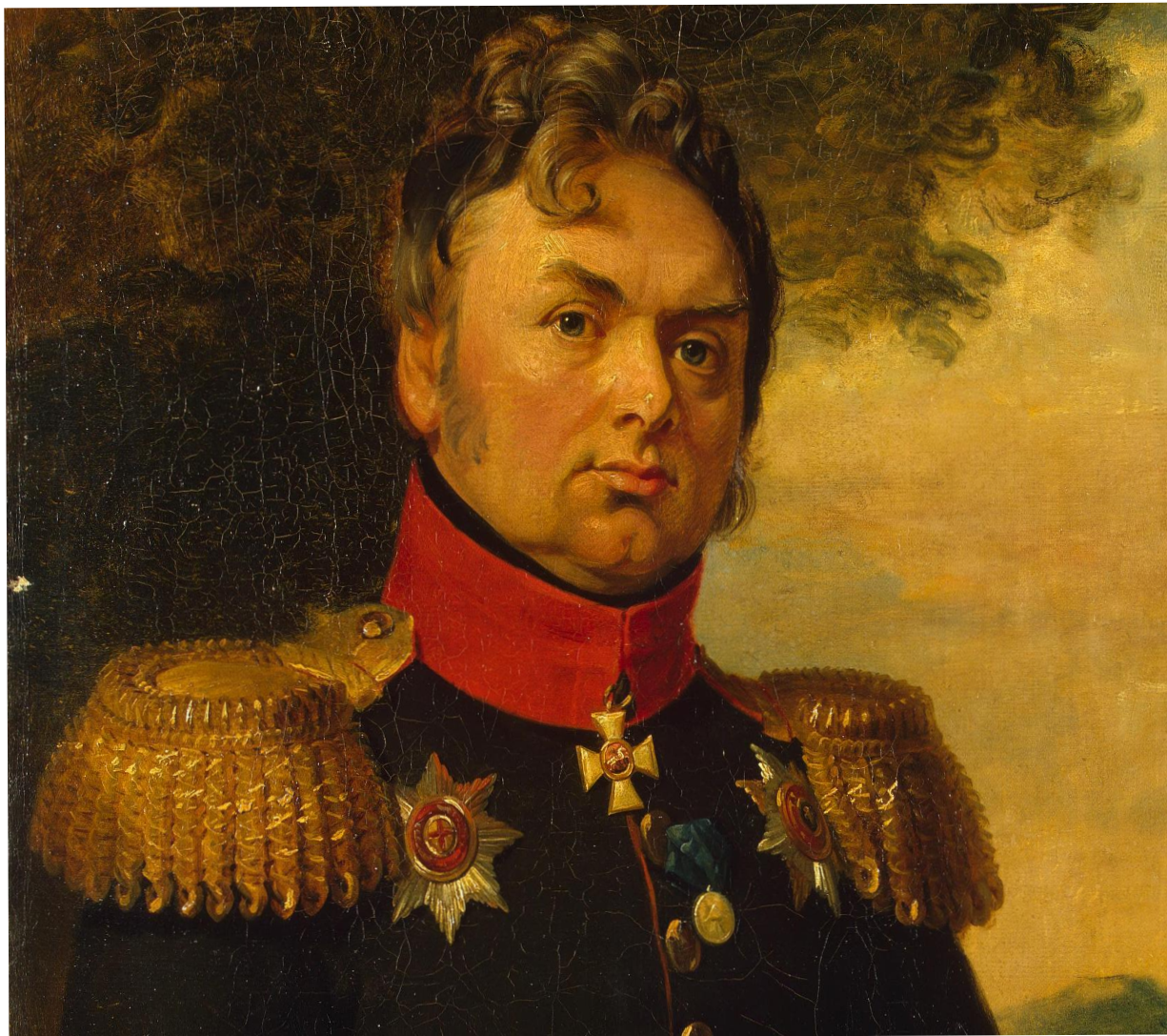
Это основатель Колтушей - Чоглоков Александр Павлович.