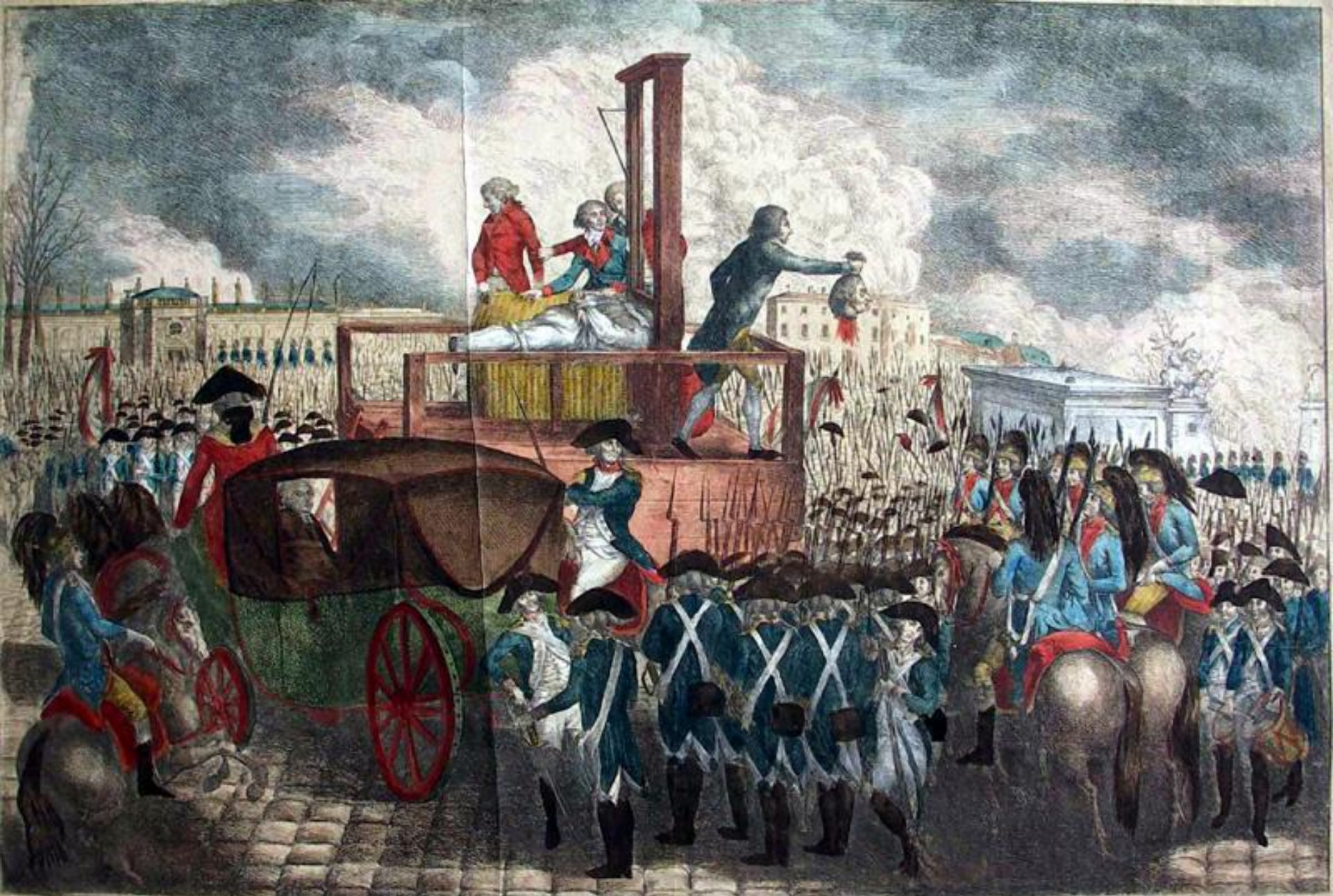
EXECUTION DE LOUIS CAPET XVI ME DU NOM, LE 21. JANVIER 1793.

A dix heures et demie du matin Louis Capet est la tête tranchée sur la Place de la Révolution ci-devant Place de Louis XV entre le Palais national et les Champs Mars. Il est arrivé au lieu de l'exécution dans le Chariot des Morts de Paris. Il est attaché à six heures à l'échafaud avec un cric et un cerceau. Il a voulu haranguer le Peuple, mais l'écroulement des poutres criminelles, l'épée du chef de bataillon et au bout du Tambourin Ce qui se dressa de suite sur son front, empêchant ainsi son discours près de l'échafaud. Les uns ont voulu le précéder au peuple. (L'écroulement des poutres criminelles, le cric et le cerceau) la tête est tombée, elle a été montrée au peuple, et le cadavre a été porté et inhumé sous le nom de Louis le Condamné, de la Province de la Normandie.