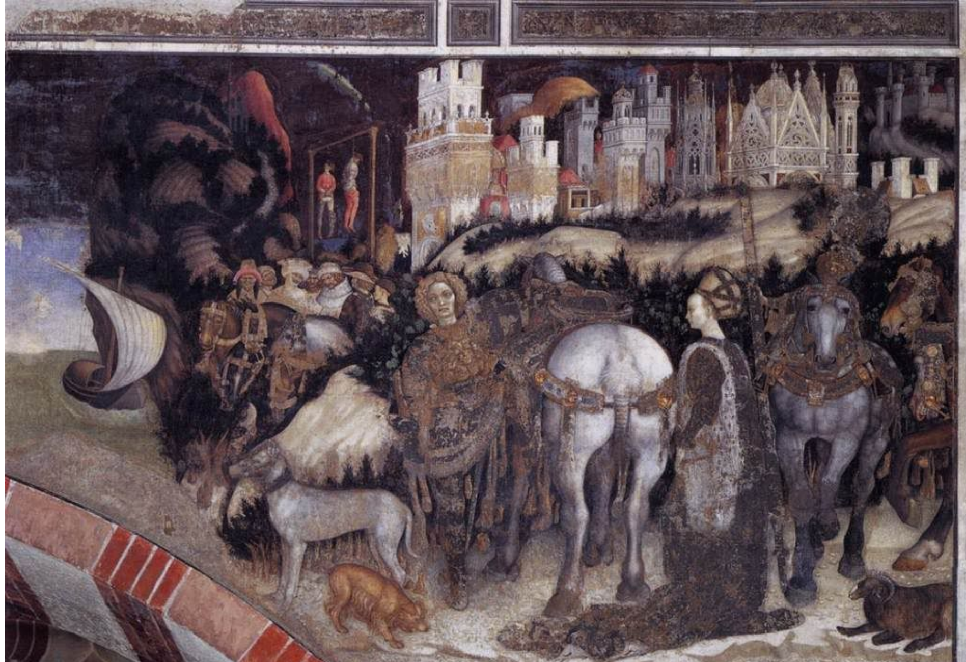
Святой Георгий и принцесса. (правая сторона) 1436-38гг. Пизанелло. Часовня Пеллегрини, церковь Санта Анастасия, Верона. Фреска.