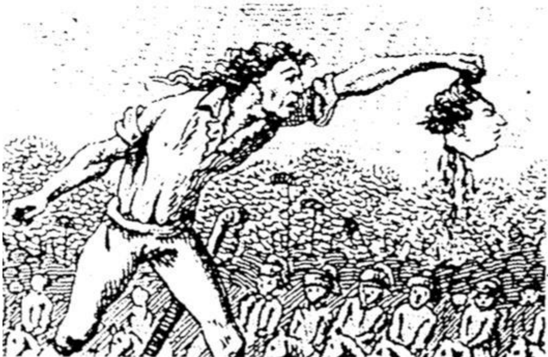
Фрагмент гравюры “Казнь Людовика XVI”.

“Хаос мимики, телесные конвульсии—это, возможно, лучший показатель невыразимого в ораторской речи эпохи.”