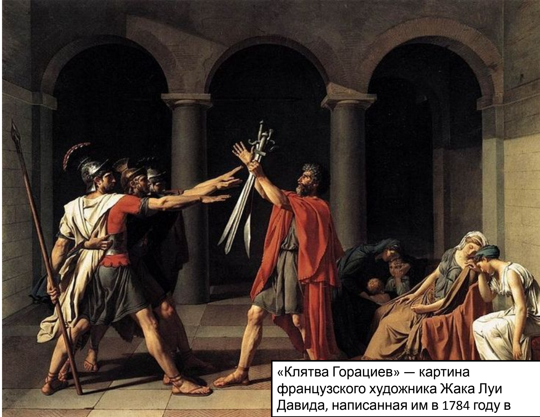
«Клятва Горациев» — картина французского художника Жака Луи Давида, написанная им в 1784 году в