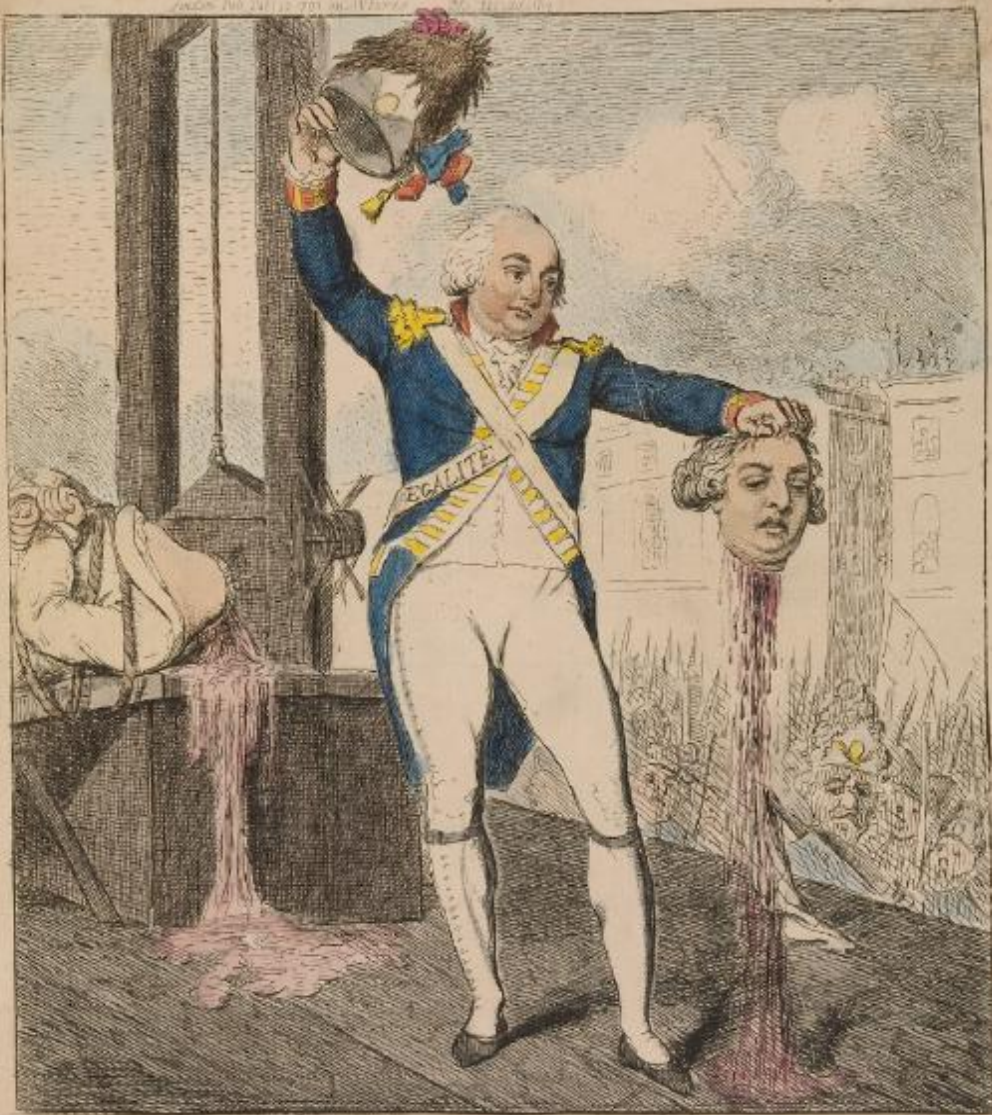
THE MARTYR of EQUALITY Behold the Progress of our System