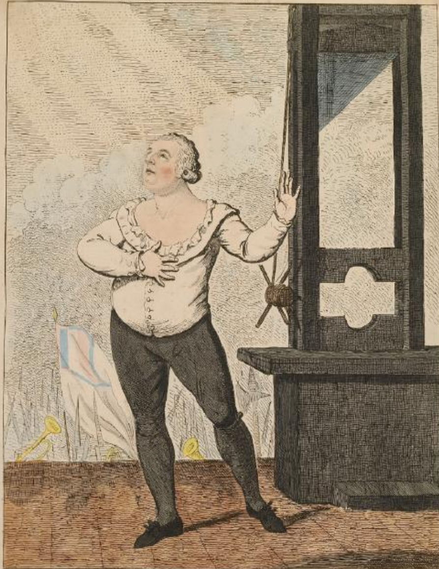
THE MARTYRDOM of LOUIS XVI. KING of FRANCE. I forgive my Enemies. I Die Innocent !!!