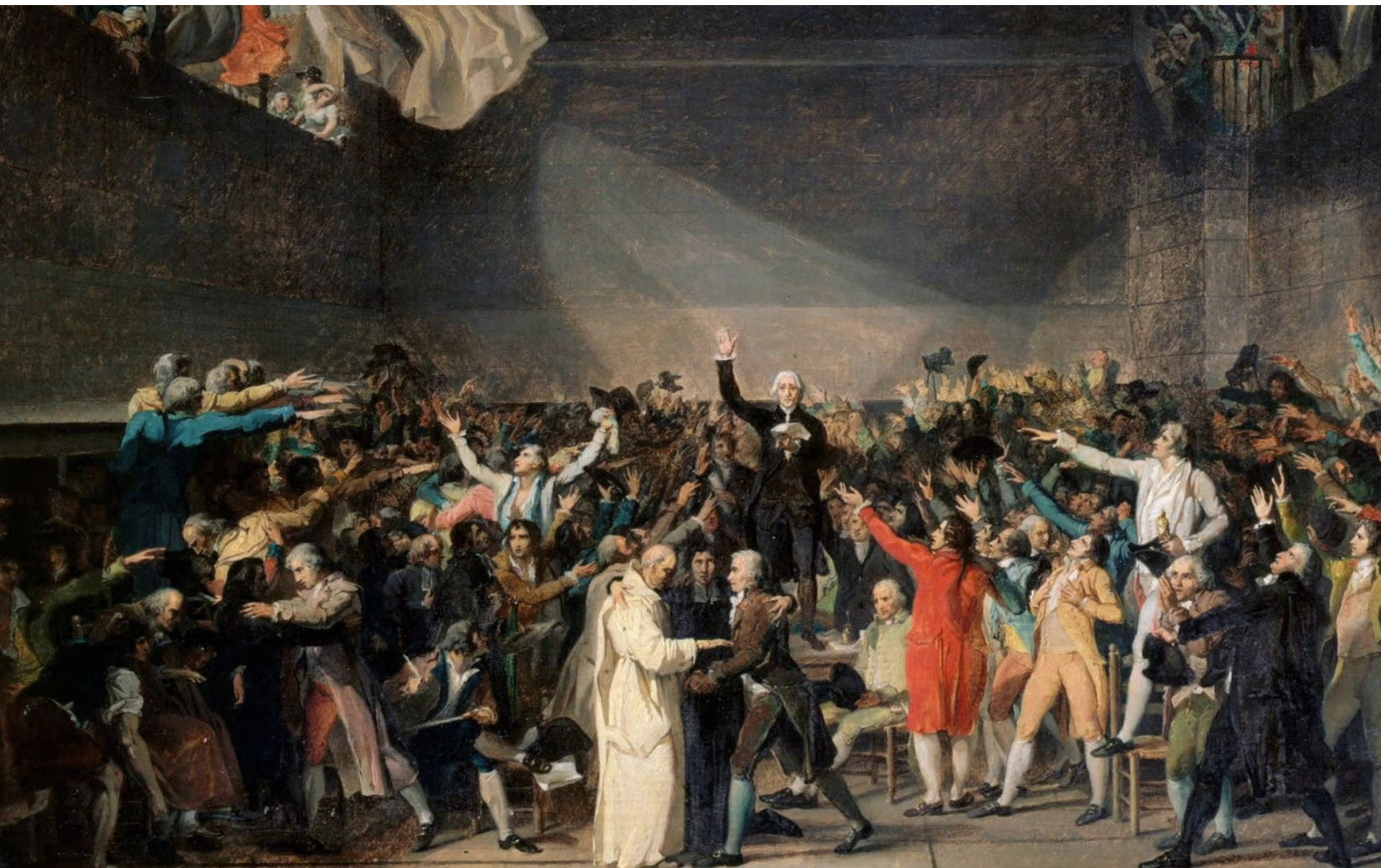
Жак Луи Давид. Клятва в зале для игры в мяч 20 июня 1789 года.