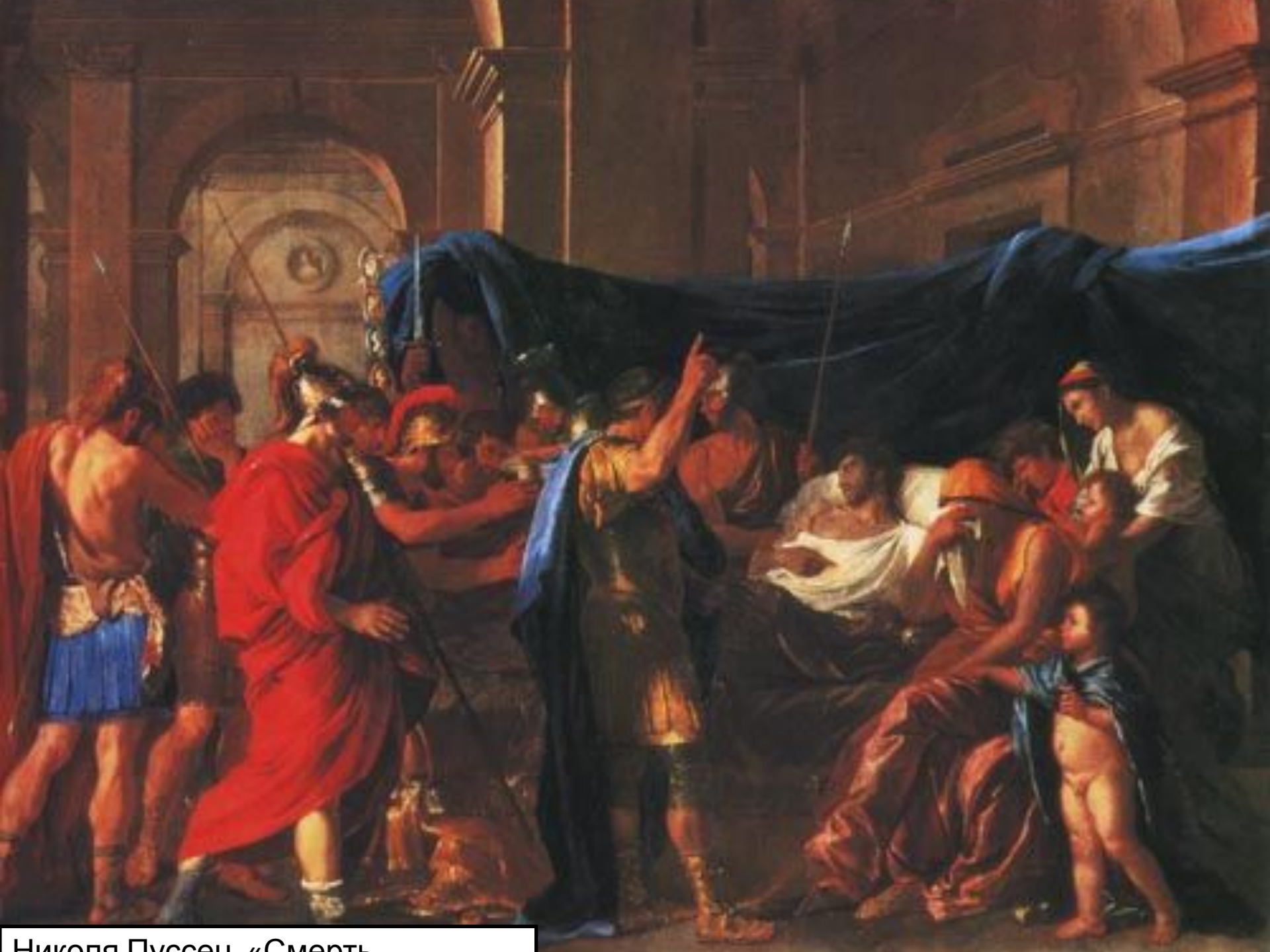
Николя Пуссен «Смерть