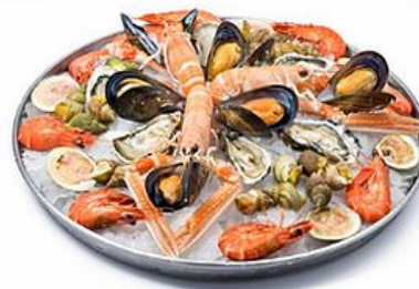
МОЛЛЮСКИ И РАКООБРАЗНЫЕ