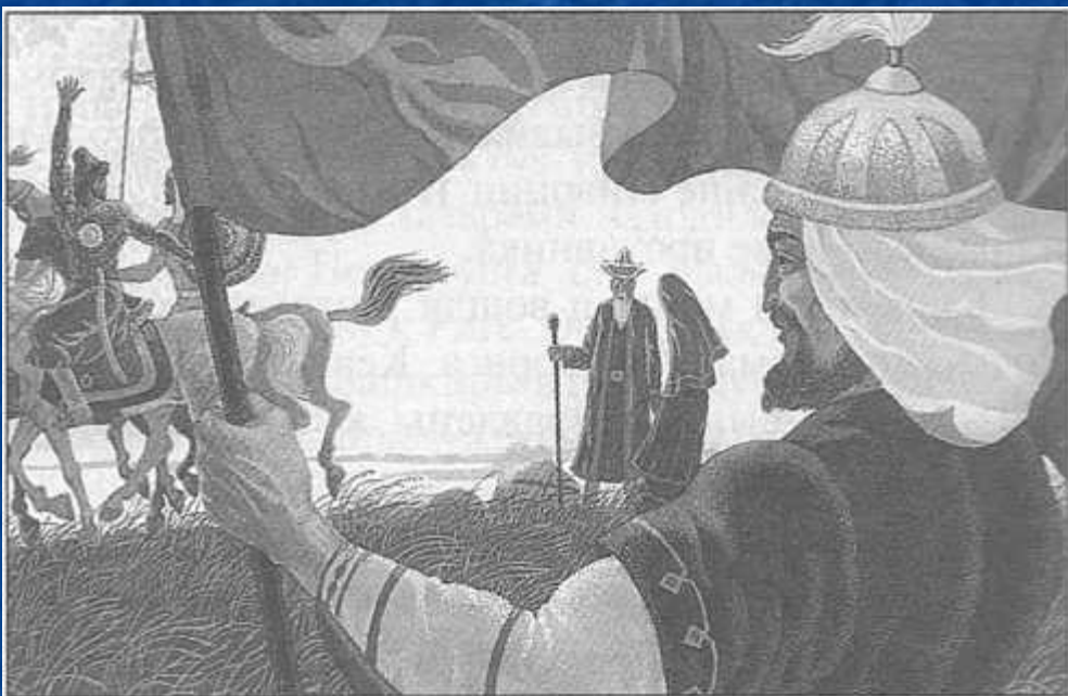
Рис. 18. Башкирские воины уходят в поход. Худ. А.Ф. Галин