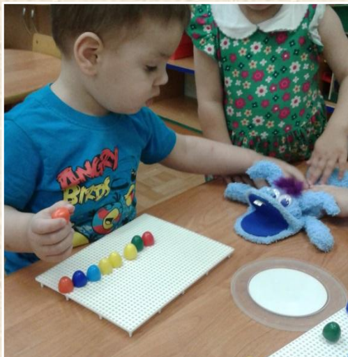
“ Выкладывание дорожки из мозаики”