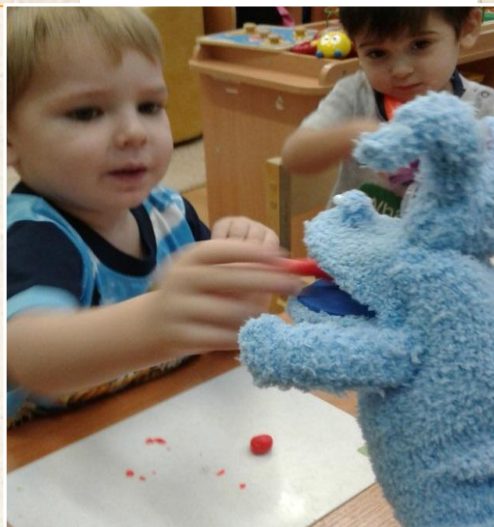
“ Угостим морковкой зайчика”