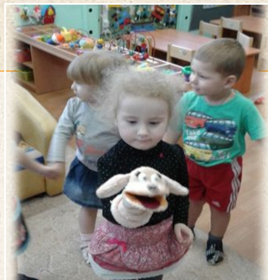
Хороводная игра “ Собачка Жучка”