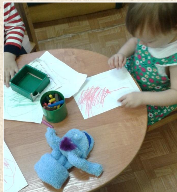
Рисование “Шарик для зайчика”