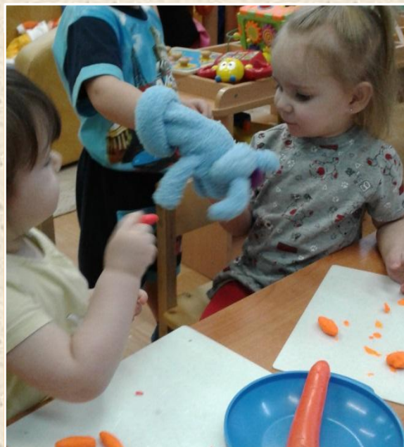
Лепка “Морковка для зайки”