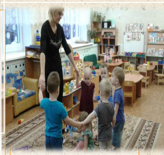
Хороводная игра “ Зайныка попляши”