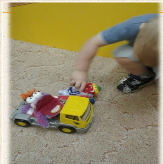
“ Покатаем Чудика на машине”