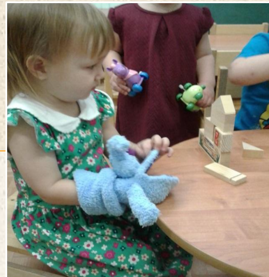
“ Домик для зайчика”