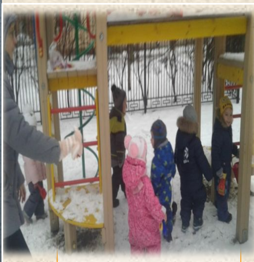
Подвижная игра “ Лохматый пес”