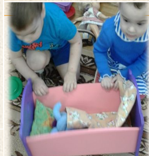
“ Уложим спать Зайчика”