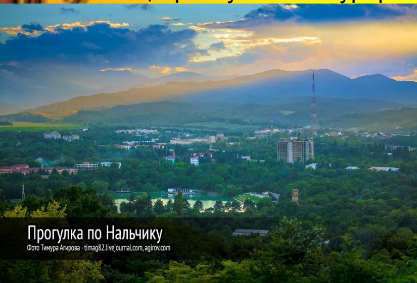
Прогулка по Нальчику

Нальчик - столица уникального края, где бережно поддерживаются многонациональные традиции, сохраняется историческое и природное наследие. Благодаря устойчивому развитию он имеет все предпосылки для того, чтобы выйти на новый этап своего развития и стать городом европейского уровня. Власти города и республики делают все возможное для того, чтобы Нальчик стал комфортнее для проживания, отвечал высоким требованиям столицы республики и курорта федерации.