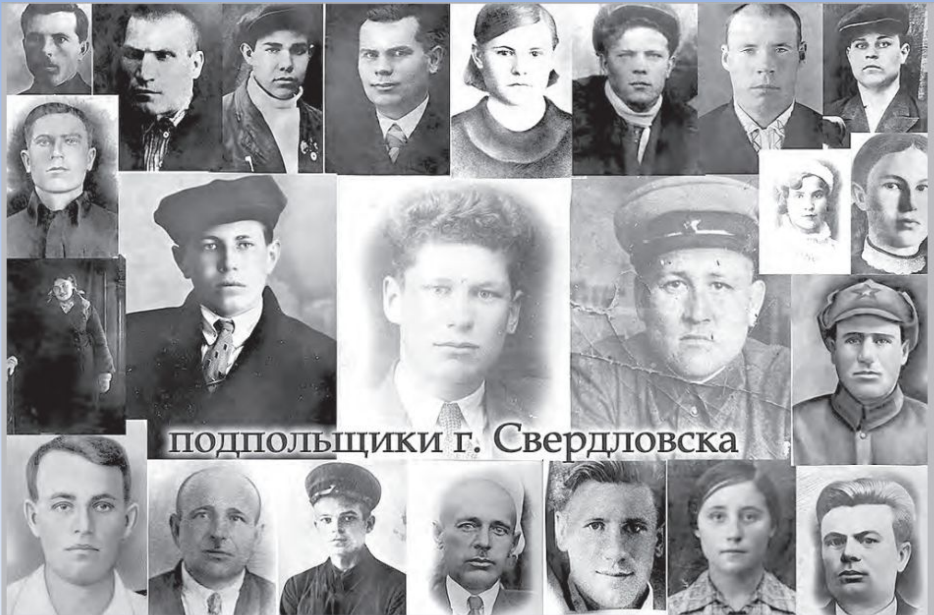
ПОДПОЛЬЩИКИ г. Свердловска