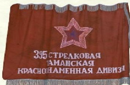
БОЕВОЕ ЗНАМЯ ДИВИЗИИ