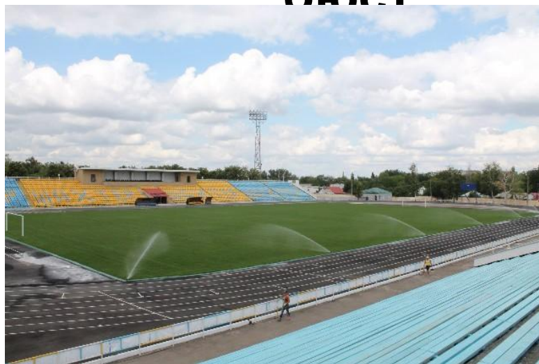
Стадион им. Горюшкина