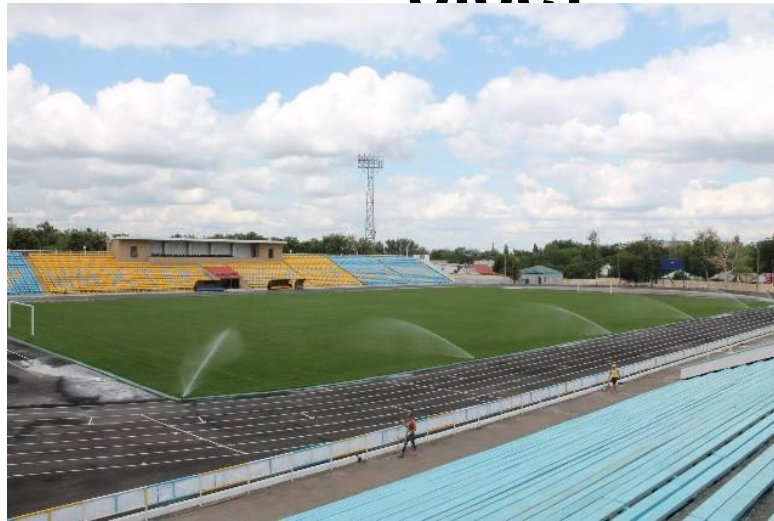
Стадион им. Горюшкина