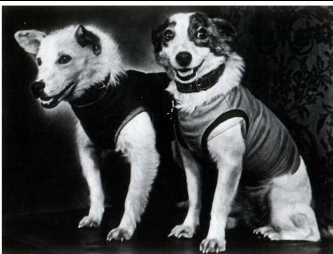
БЕЛКА И СТРЕЛКА