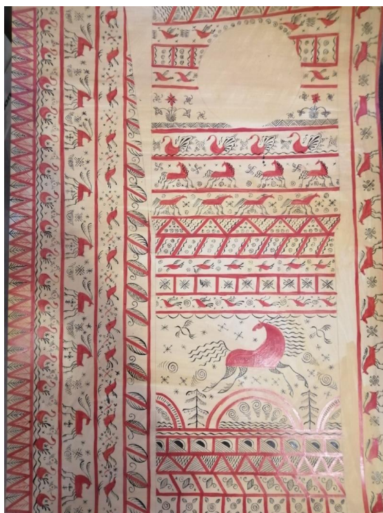
Эскиз верхней и боковой части БМП «Курганец-25»