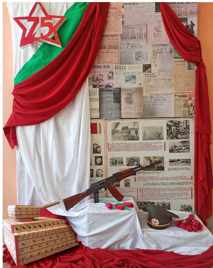
Готовое изделие в фотозоне на военную тематику