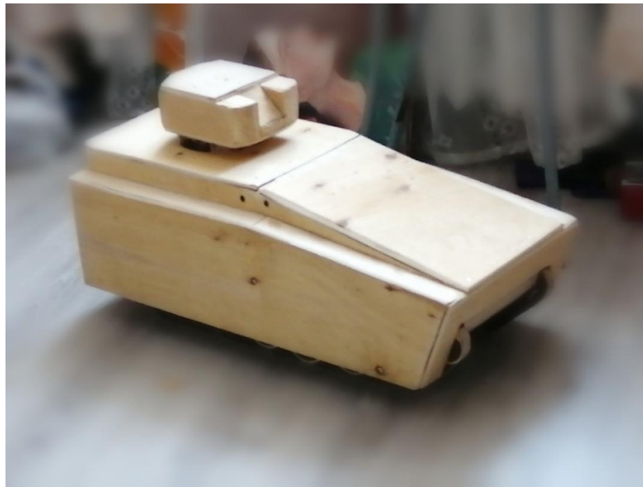
Отшлифованная заготовка БМП «Курганец-25»