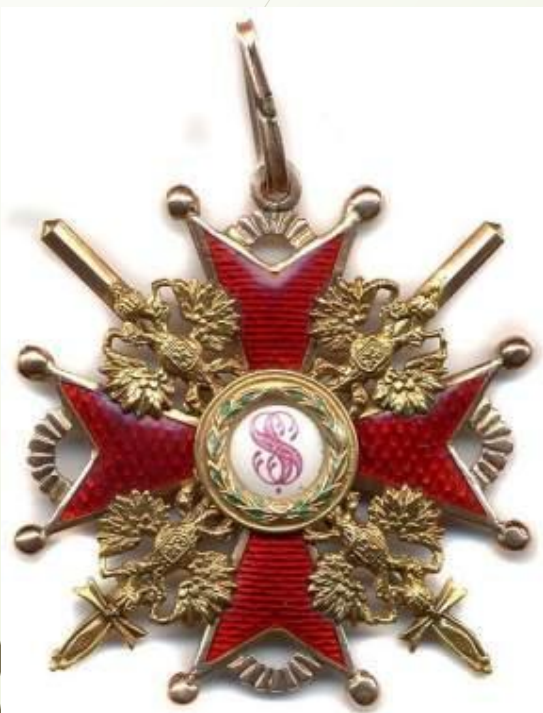
1915 г. Орден Святого Станислава III ст.