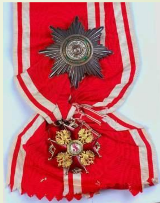
1916г. Орден Святого Станислава II ст.