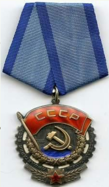
1939г. Орден Трудового Красного Знамени.