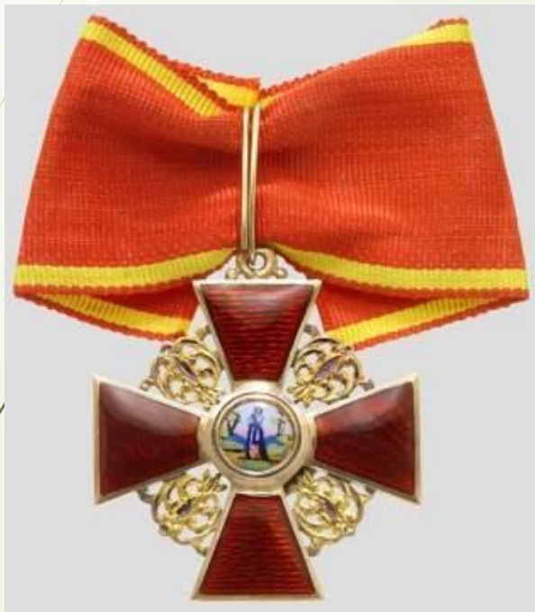
1916 г. Орден Святой Анны IV ст.