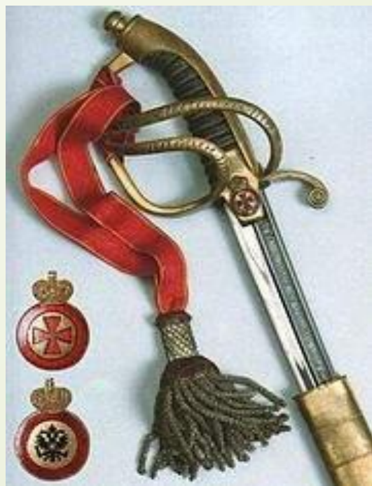
1916 г. Орден Святой Анны IV ст.