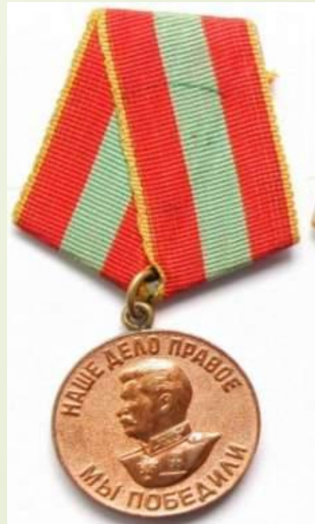
1946г. Медаль «За доблестный труд в Великой Отечественной войне 1941—1945 гг.»