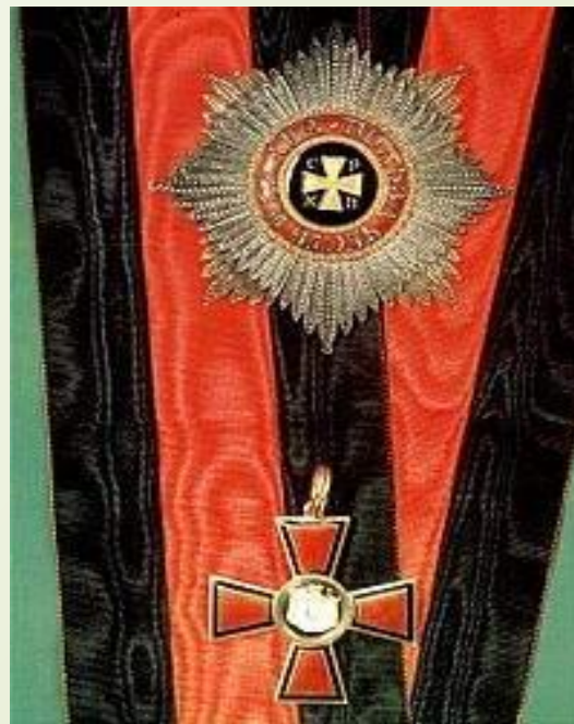
1917г. Орден Святого Владимира IV ст.