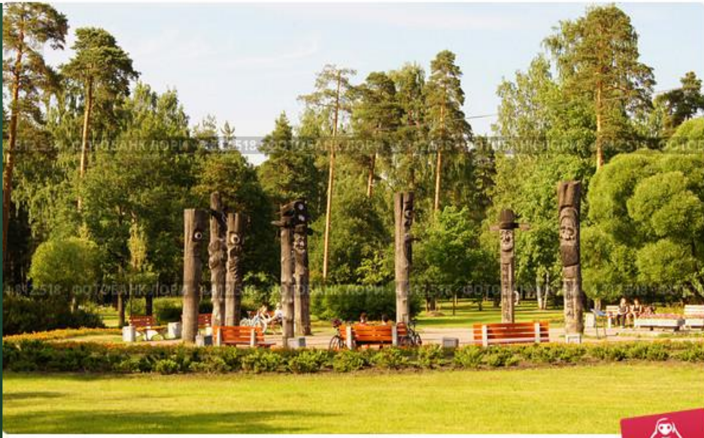
Группа деревянных скульптур чансын, установлена в парке "Сосновка" в Сан