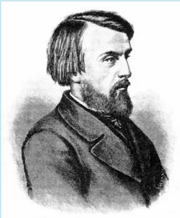
Виссарион Григорьевич Белинский 1811-1848 Русский литературный критик