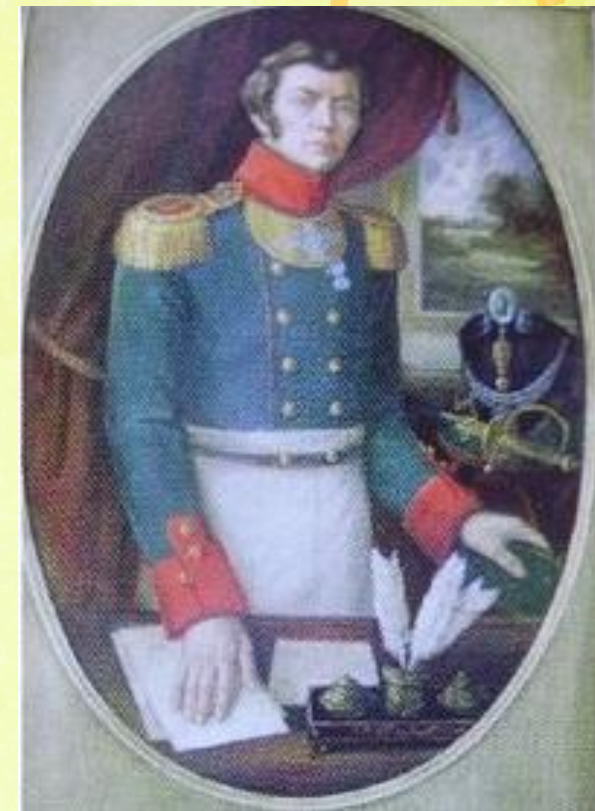
Владимир Федосеевич Раевский (1795 – 1872). Герой Бородино, «первый декабрист», поэт, публицист.

Говоря о значении Раевского в истории русского государства, в истории русской литературы, необходимо признать, что именно он стал той отправной точкой за освобождение крестьян от гнёта крепостного права, которая много лет спустя всё-таки осуществила заветную мечту мыслящей части русского общества и всего крестьянства. Именно он с собратьями по перу заложили в литературу идеи истинного патриотизма и гражданственности.