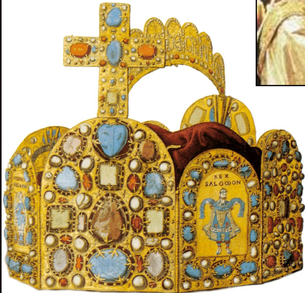
Корона Карла Великого