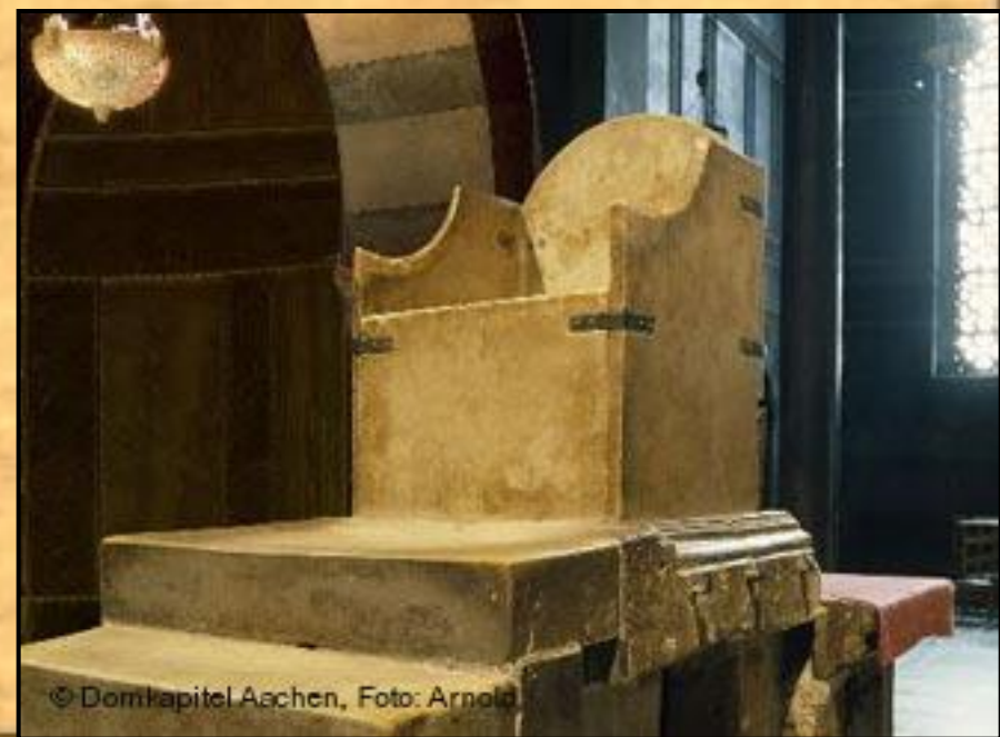
Трон Карла Великого