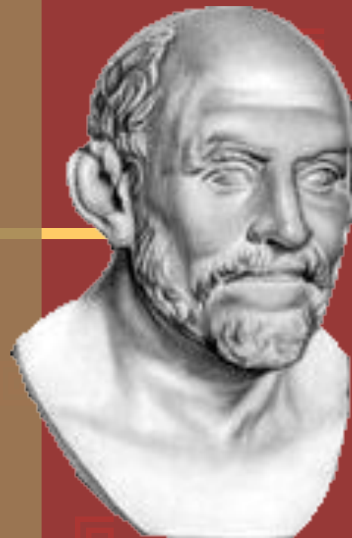
Демокріт (бл. 460-370)