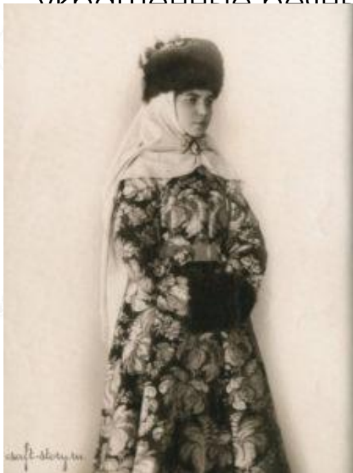
Меховая шапка с убрусом

Зимой женщины и девушки обычно носили все те же головные уборы с убрусом, бедные ограничивались одними платками. Богатые же могли позволить себе меховые шапки, вышитые шелком и золотыми нитями, украшенные перламутром и драгоценными камнями.