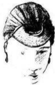
Рис. 15 б. Сдериха.