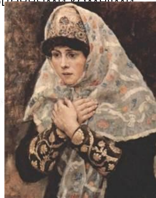
Треух с убрусом