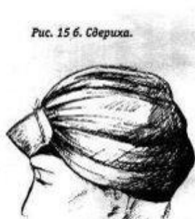
Рис. 15 б. Сдериха.