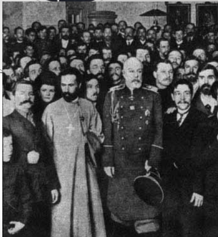
Георгій Гапон с членами «Союза фабричныхъ и заводскихъ рабочихъ»