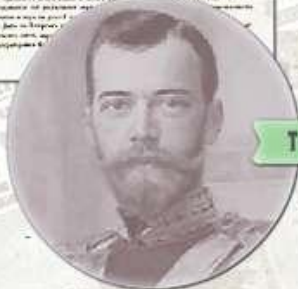
Рис. 1. Манифест от 17 октября 1905г.

УТВЕРЖДЕНИЕ ЗАКОНОВ НАЗНАЧЕНИЕ МИНИСТРОВ ВНЕШНЯЯ ПОЛИТИКА