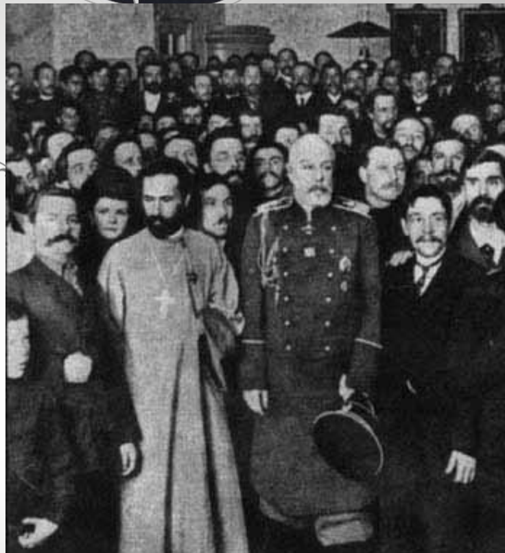
Георгій Гапонъ съ членами «Союза фабричныхъ и заводскихъ рабочихъ»