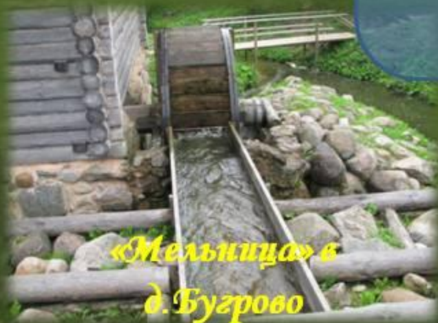
«Мельница» в д. Бугрово