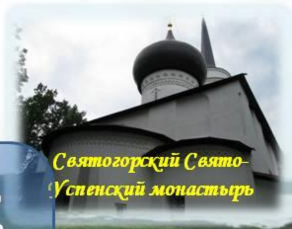
Святогорский Свято-Успенский монастырь

Пушкиногорье – это то место, в котором душа поэтически настраивается на высокое и благородное, учится миру, тишине, покою.