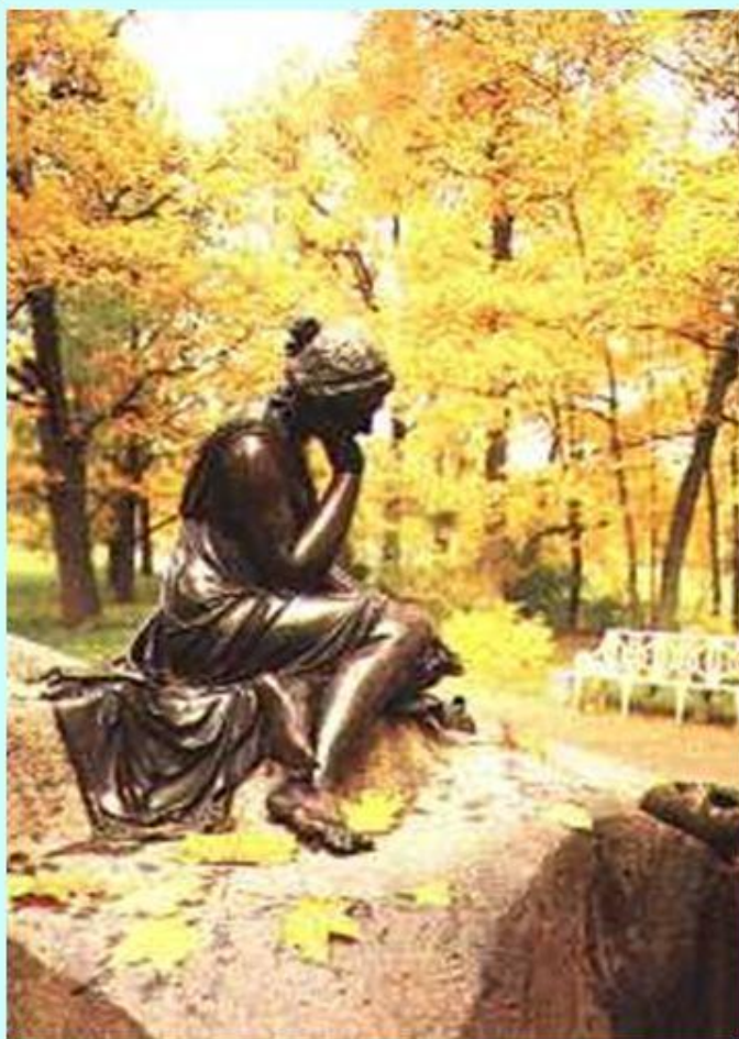
Сквер у лицей