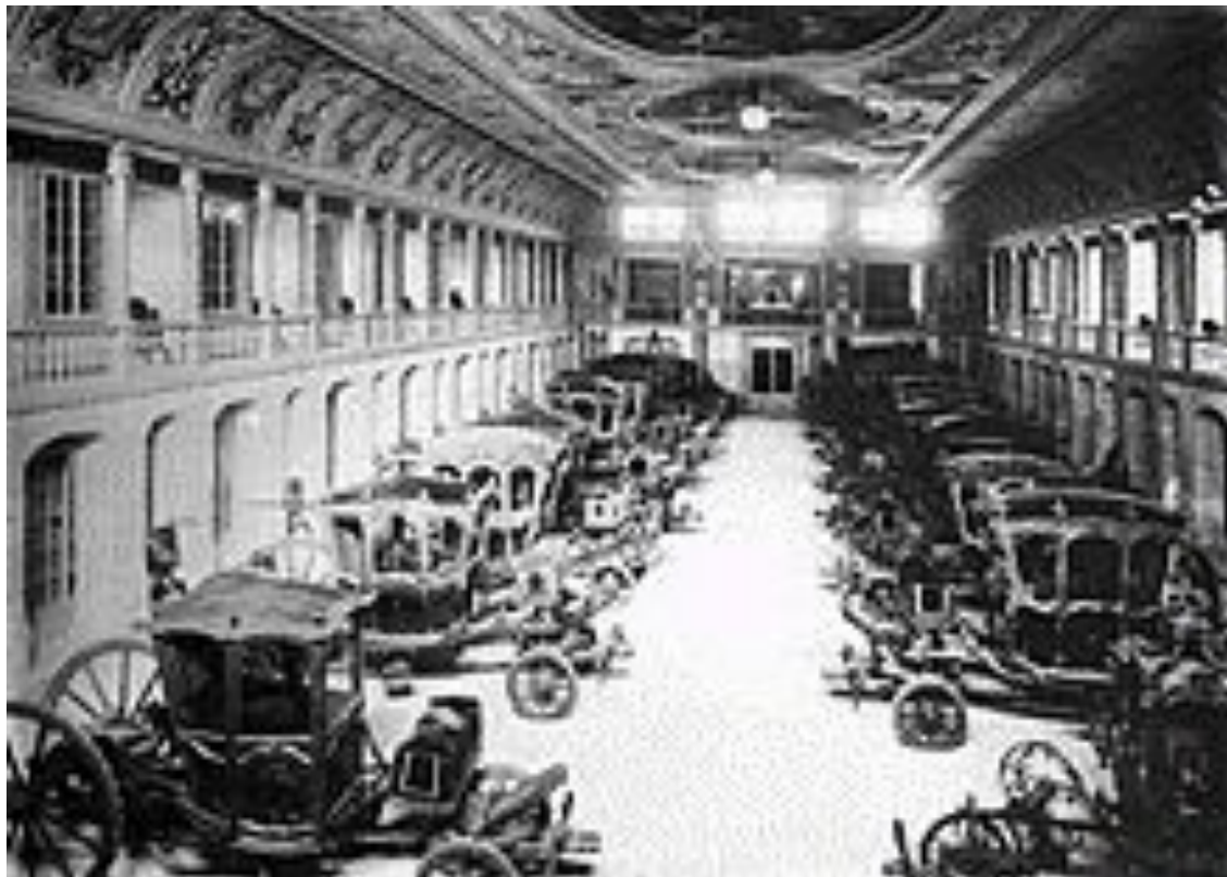
Выставка королевских экипажей, ок. 1907