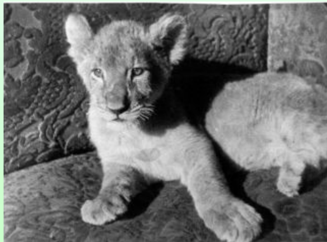
Льенок Кинули. Москва, Лето 1935.

В 1937 году была опубликована её вторая книга «Мои воспитанники». В неё вошли рассказы : «Арго», «Лоська», «Тюлька» и другие. Также была написана повесть «Кинули».