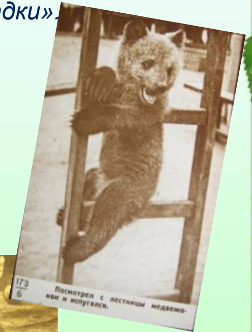
173 6. Посмотрел с лестниц медвежонки и испугался.