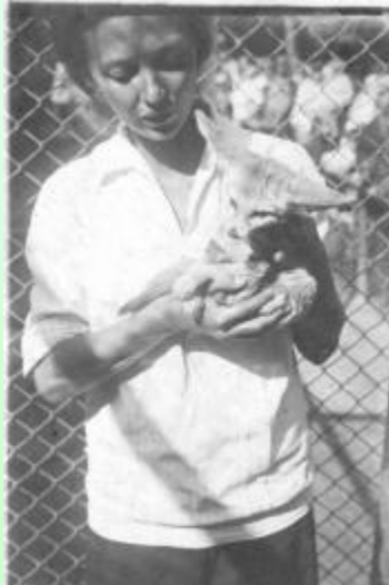
В. Чаплина с ушастой лисицей. Площадка молодняка Московского зоопарка, 1933.

В 25 лет Вера Чаплина становится одним из новаторов Московского зоопарка.