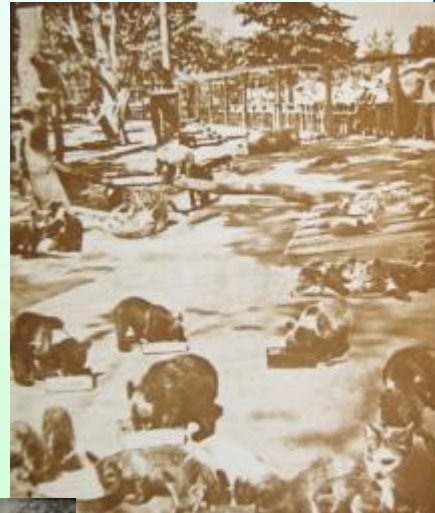
В московском Зоопарке шадна молодняка. Живу площадке разные зверюц у этих зверюшек игр и з