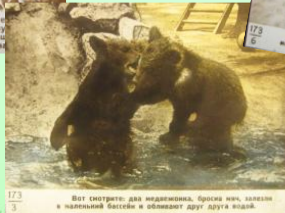
Вот смотрите: два медвежонок, бросаю мяч, залезли в наленький бассейн и обливают друг друга водой.