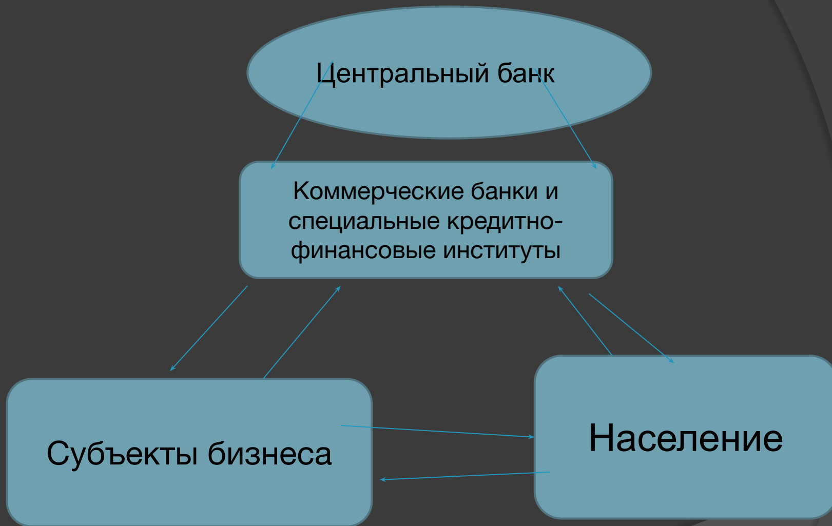
Схема денежного оборота внутри экономической системы