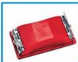
КОЛОДКА ДЛЯ ШЛИФОВАЛЬНОЙ ШКУРКИ