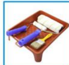
ВАННОЧКА ДЛЯ ВАЛИКОВ И КИСТЕЙ