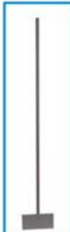
СКРЕБЕО С УДЛИНЕННОЙ РУЧКОЙ