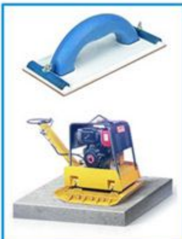
ПРИСОСОДЖЕНИЕ ДЛЯ ШЛИФОВАКИ ПОВЕРХНОСТЕЙ