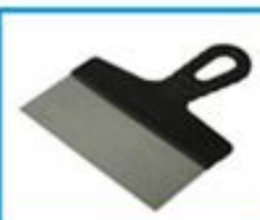
СТАЛЬНОЙ ШПАТЕЛЬ ПШС