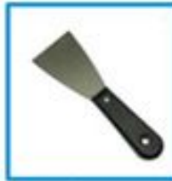
СТАЛЬНОЙ ШПАТЕЛЬ ПШД