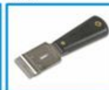
НОЖ ДЛЯ ОЧИСТКИ СТЕКОЛ