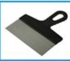
СТАЛЬНОЙ ШПАТЕЛЬ ПШС