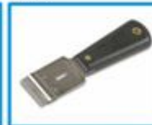
НОЖ ДЛЯ ОЧИСТКИ СТЕКОЛ