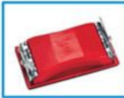
КОЛОДКА ДЛЯ ШЛИФОВАЛЬНОЙ ШКУРКИ