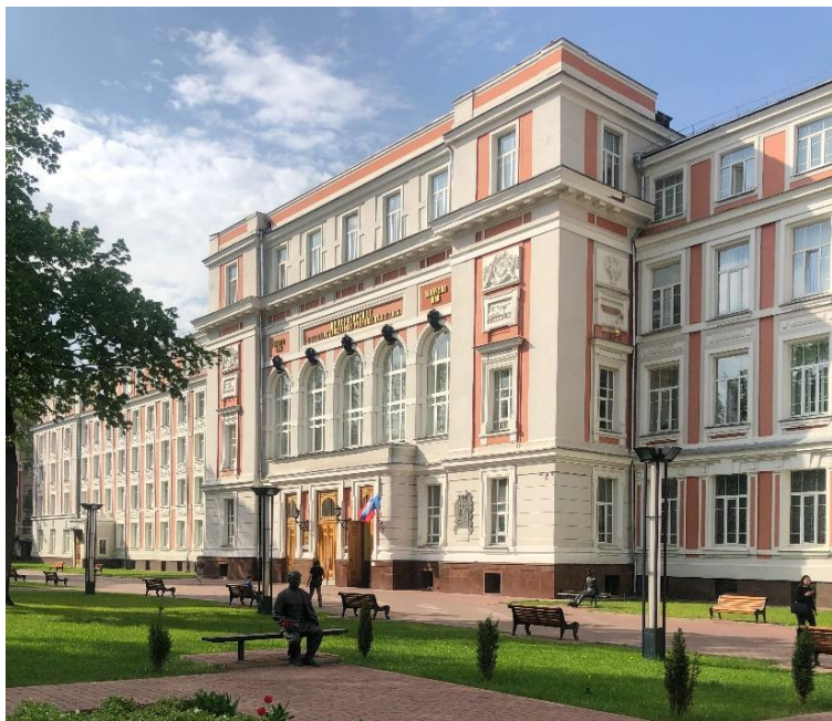
1 корпус (ИУЦТ)