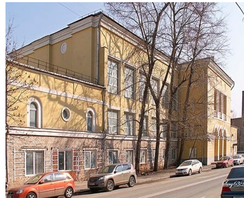
12 корпус (ИМТК)