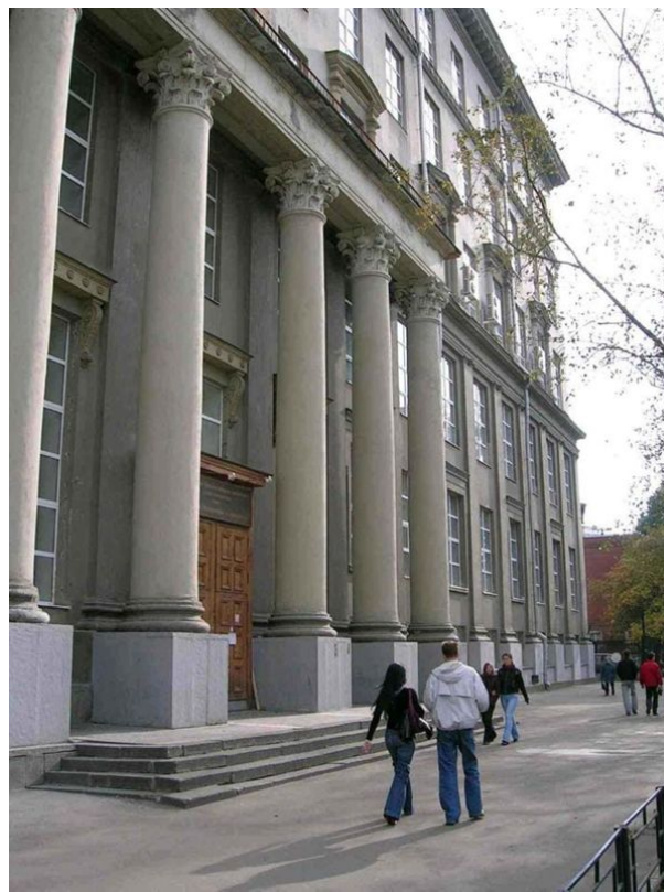
3 корпус (ИЭФ)