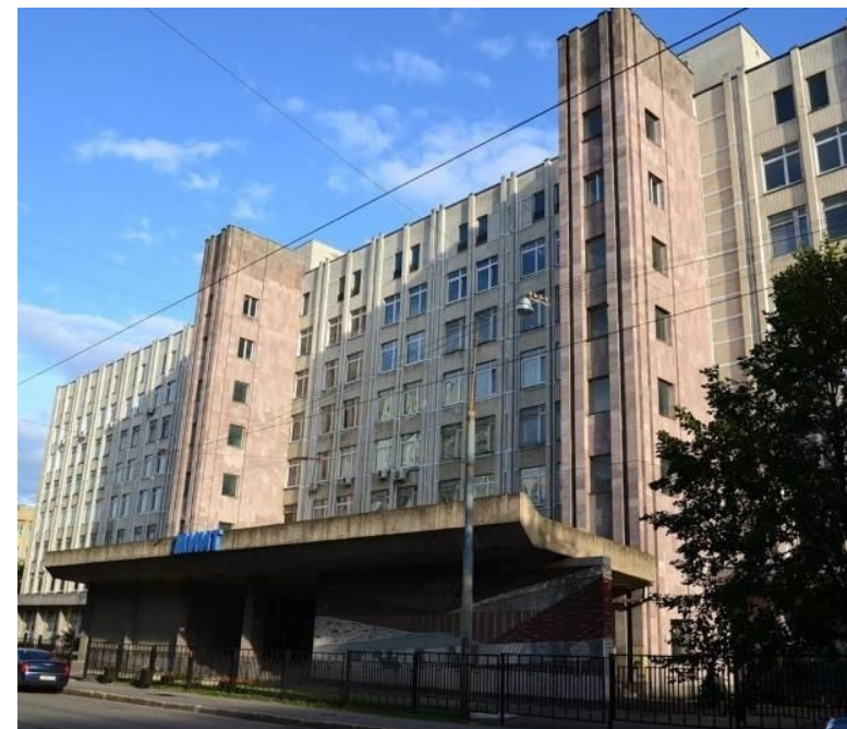
7 корпус (ИПСС)