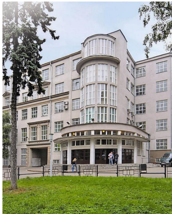
2 и 4 корпуса (ИТТСУ)