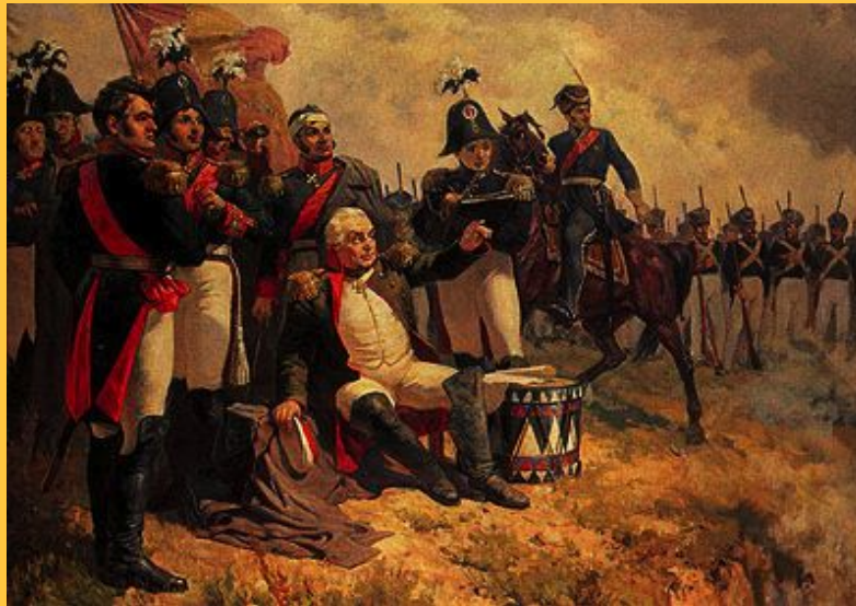
А. Шепелюк. “М.И. Кутузов на командном пункте в день Бородинского сражения “

Русские войска во время отступления ждали этого боя. Они были полны решимости померяться силами с противником и готовы лучше умереть, чем пропустить врага. Искусный полководец Кутузов умело организовал сражение на Бородинском поле. 7 сентября 1812 г. от 6 до 18 часов численно превосходящие силы французов непрерывно атаковали русских. Двенадцать часов, почти не прекращаясь, шли жесточайшие рукопашные схватки, стреляли с обеих сторон до 1000 орудий. Полки русских и французов целиком погибали в бою, не уступая друг другу ни шагу.