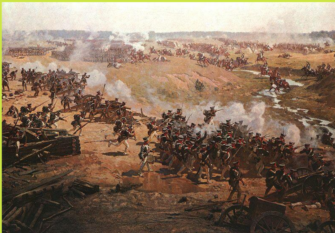
Рубо Франц Алексеевич. Бородинская битва. Панорама. Фрагмент

Но русские и не думали складывать оружие. Назначенный, главнокомандующим, талантливый боевой генерал, любимец солдат и офицеров Михаил Илларионович Голенищев-Кутузов решил преградить Наполеону путь на Москву и дать генеральное сражение французам на Бородинском поле.