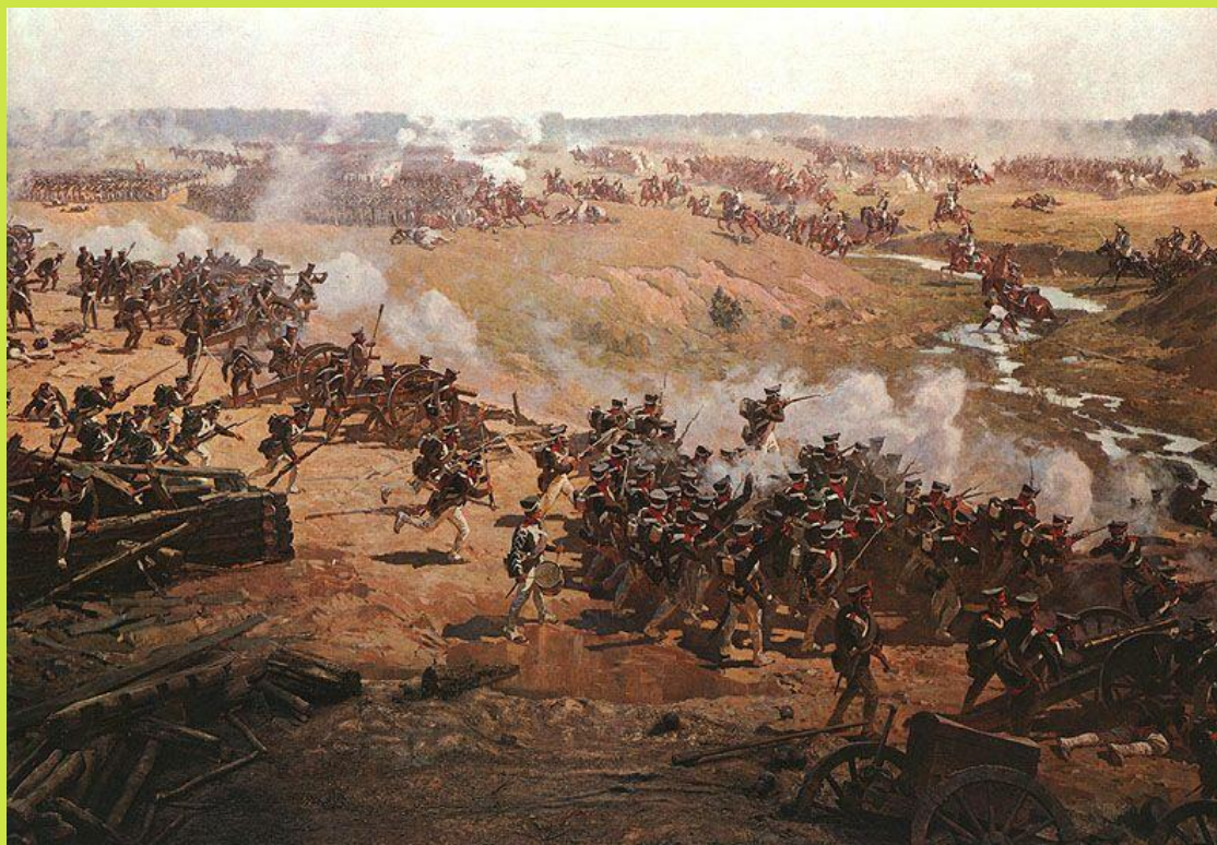
Рубо Франц Алексеевич. Бородинская битва. Панорама. Фрагмент