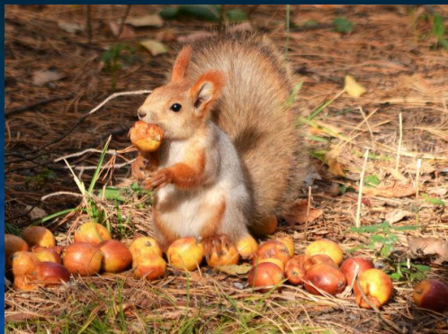
5. Белка делает запасы