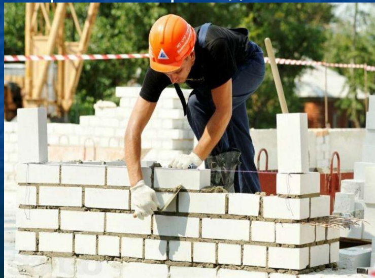
7. Строитель строит дом