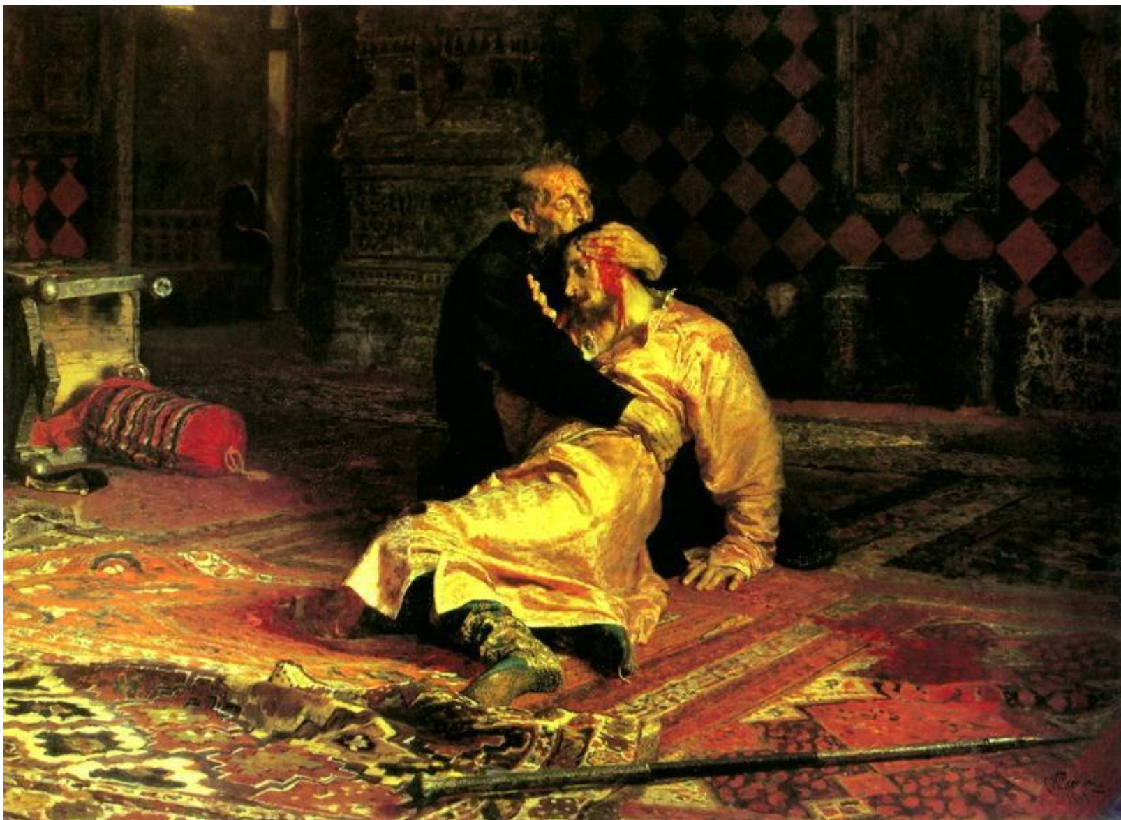
Репин И. Е. «Иван Грозный и сын его Иван 16 ноября 1581 г.» (1885)