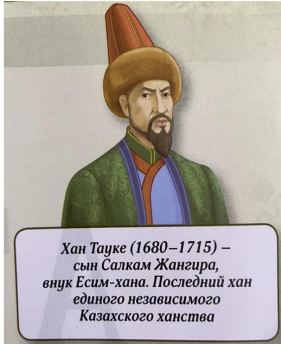
Хан Тауке (1680–1715) – сын Салкам Жангира, внук Есим-хана. Последний хан единого независимого Казахского ханства