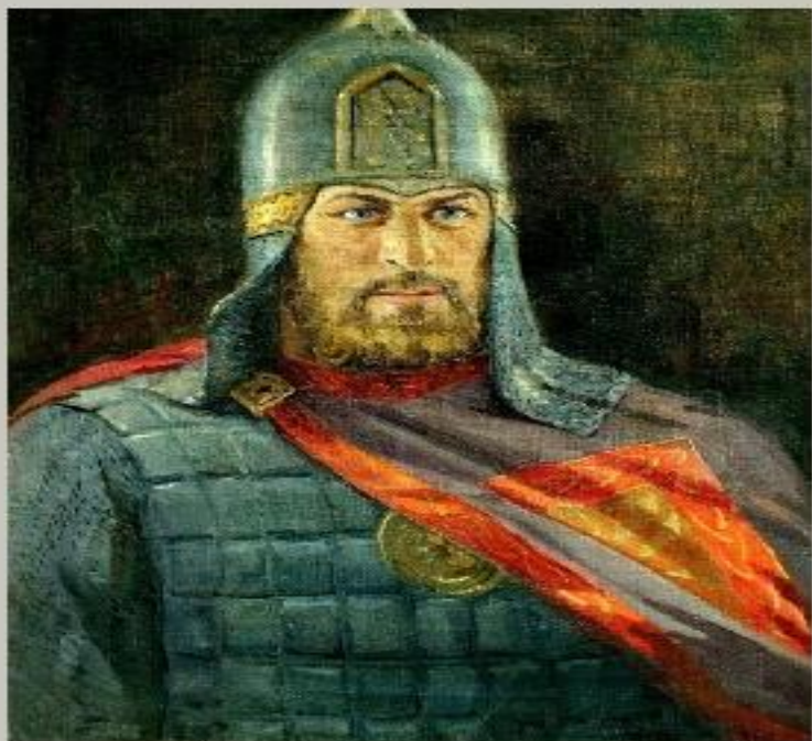
Святой благоверный князь Александр Невский

Святой князь Александр Невский был дарован Господом Руси в один из тяжелейших моментов ее истории. Тогда с востока ей угрожали монголо – татары, а с запада – полчища рыцарей – католиков, мечтавших захватить ее и искоренить Православие.