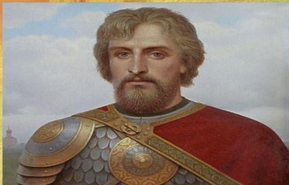
«Князь Александр Невский» Художник В. М. Тормосов

Шло время, появлялись новые герои, однажды об Александре Невском забыли... и вспомнили через 700 лет.