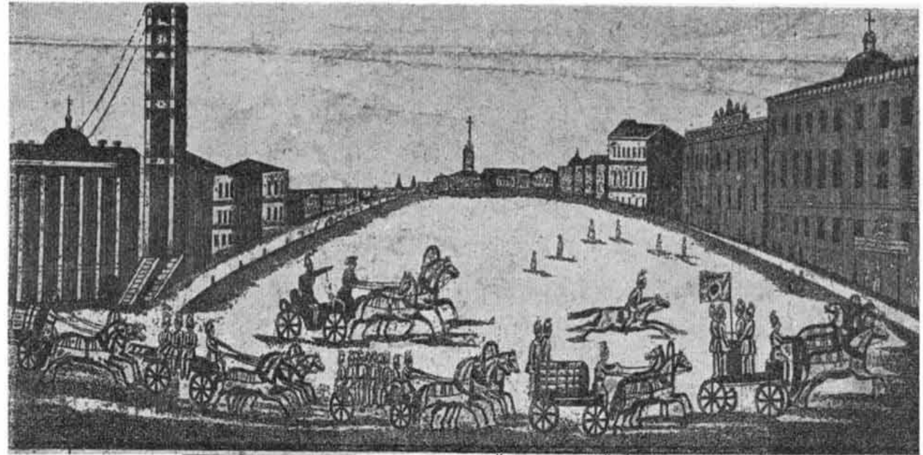
СИГНАЛЫ ДЛЯ С. ПЕТЕРБУРГСКОЙ ПОЖАРНОЙ КОМАНДЫ

“Во время пожара на наблюдательной вышке Кургана поднимались они: один — если пожар разгорался в восточной части города и два — если огонь замечали в западной части”.