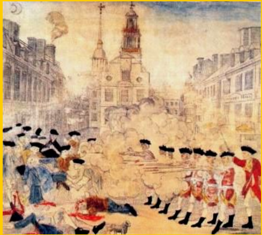
Бостонский расстрел. Неизвестный художник.