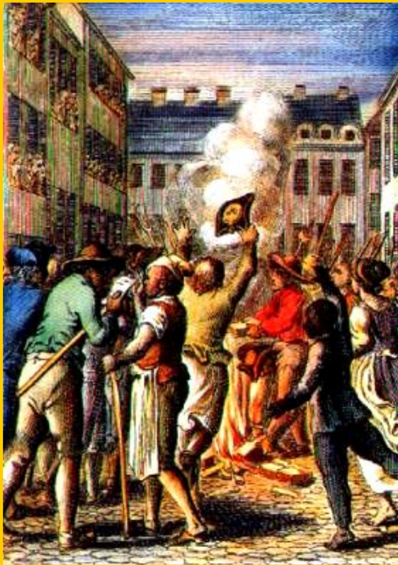
«Нет-гербовому сбору!» Гравюра 18 в.