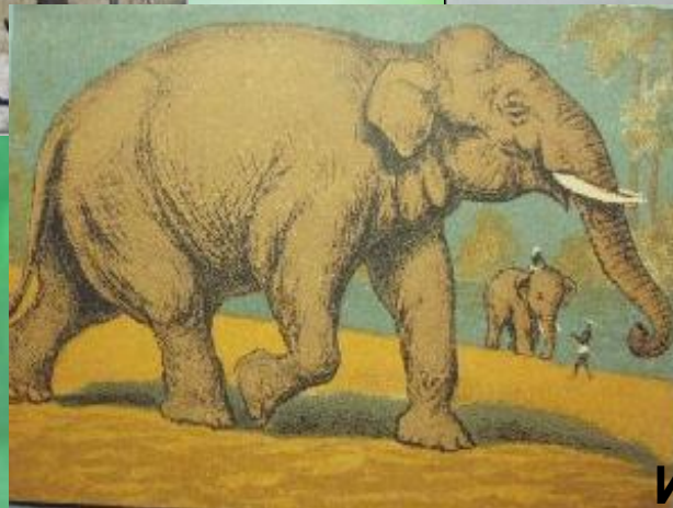
Индийский слон. В.