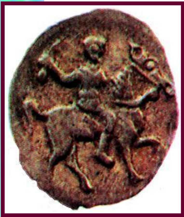
Копейка 1547 г.

Рост объема торговли требовал изменений в системе денежно-го обращения. В стране не ходило большое количество фальшивых денег и существовало 2 денежных системы-новгородская и московская.