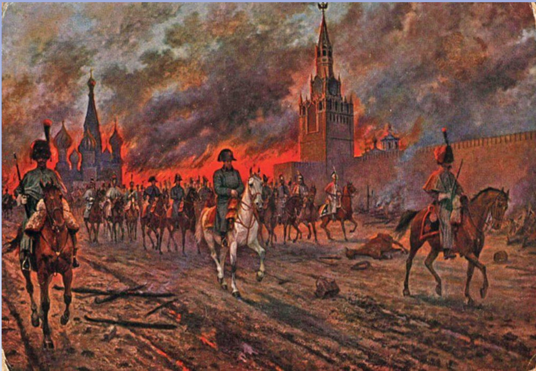
«Москва, спаленная пожаром, Французам отдана» в сентябре 1812 года.