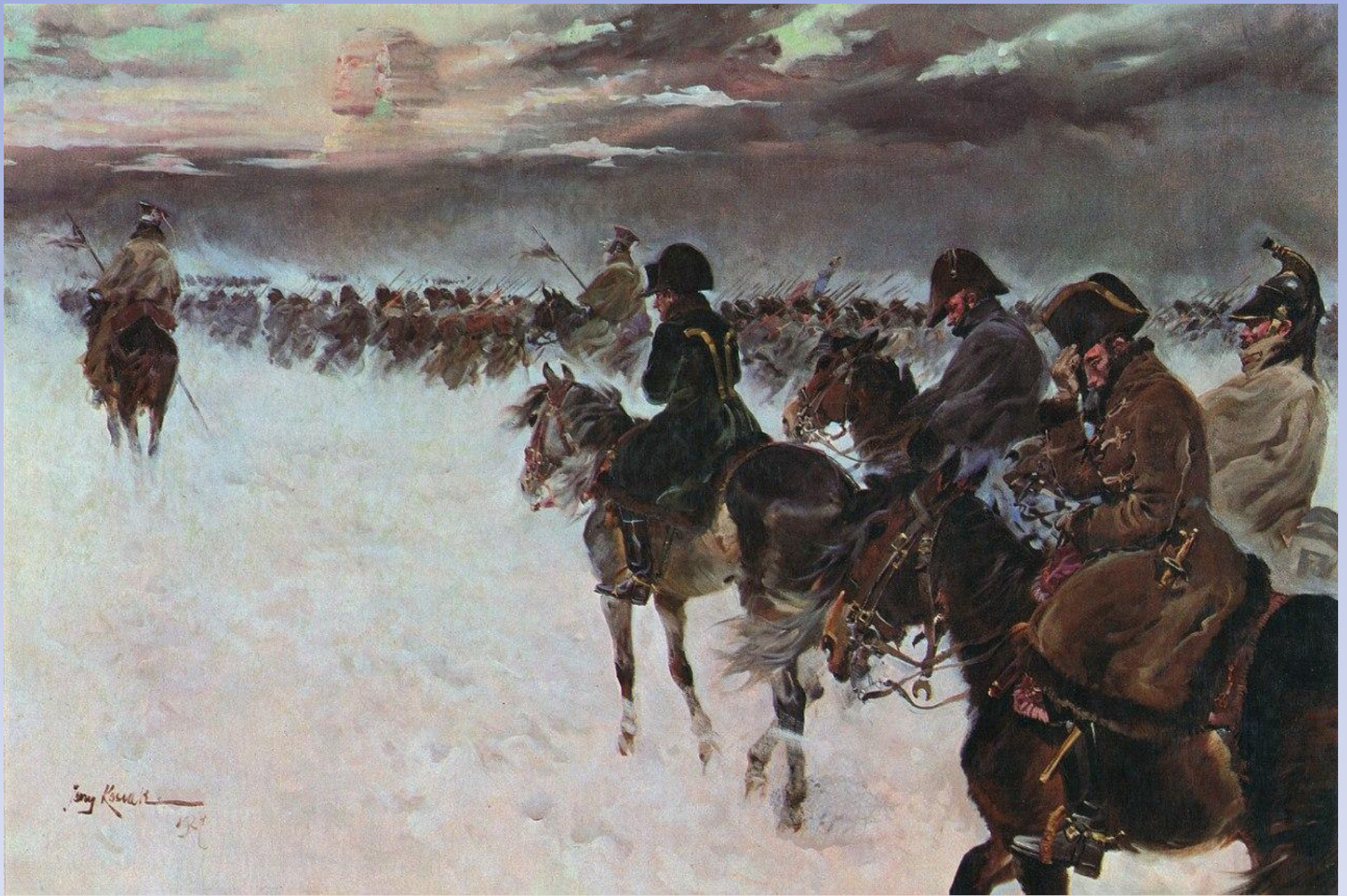
Отступление французской армии из России. Октябрь – Ноябрь 1812 года. • Обратите внимание на сфинкса. •