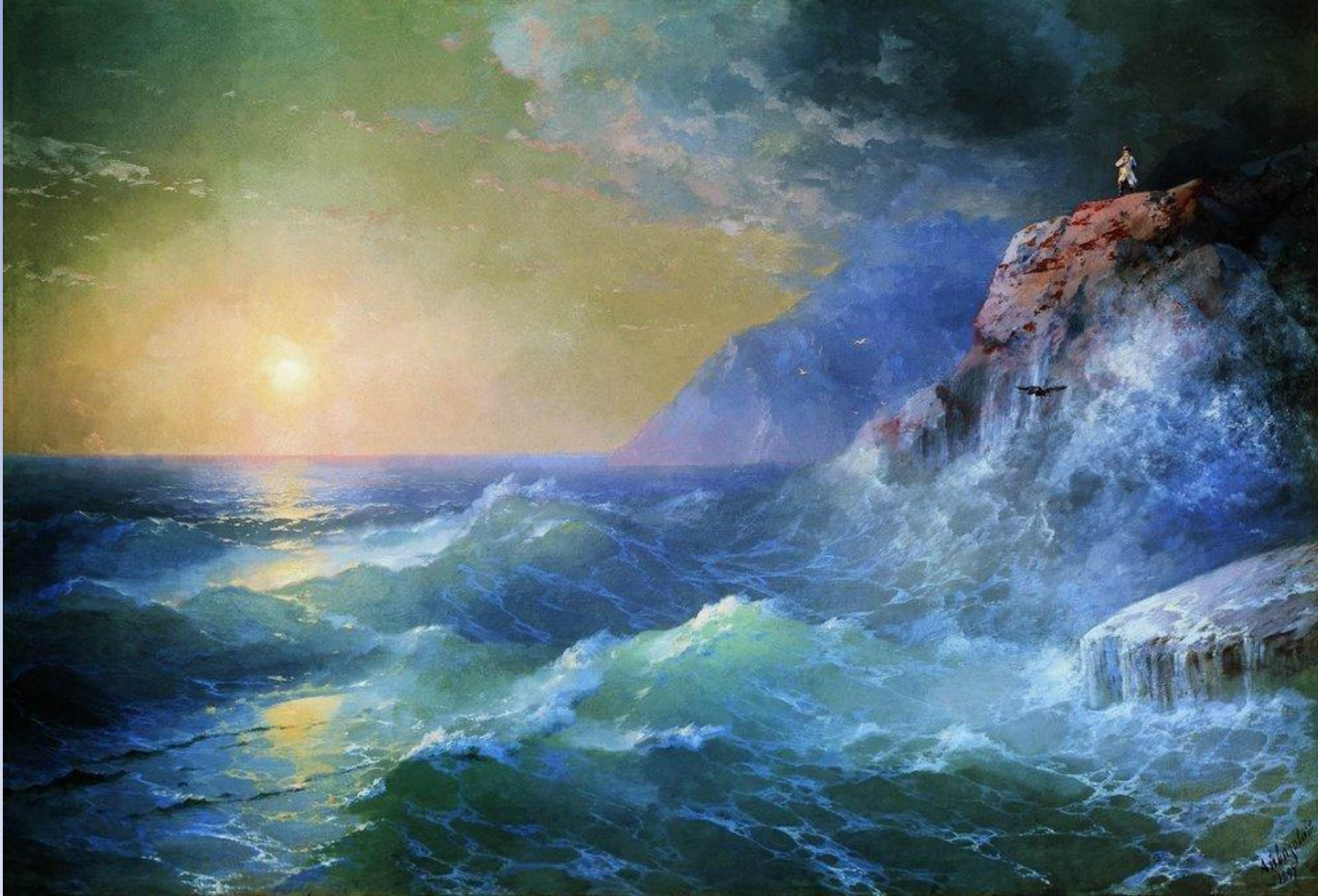
«Наполеон на острове Святой Елены» Автор картины: Иван Айвазовский.