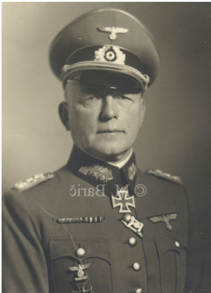
▶ Эвальд фон Клейст