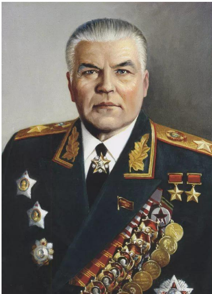
Родион Яковлевич Малиновский