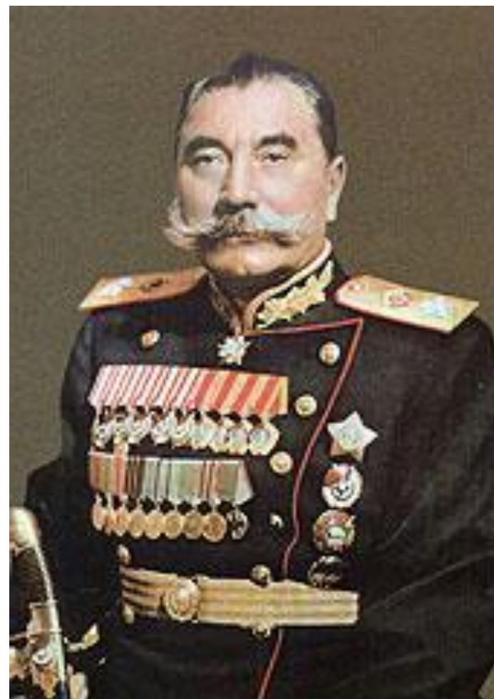
Буденный Семен Михайлович