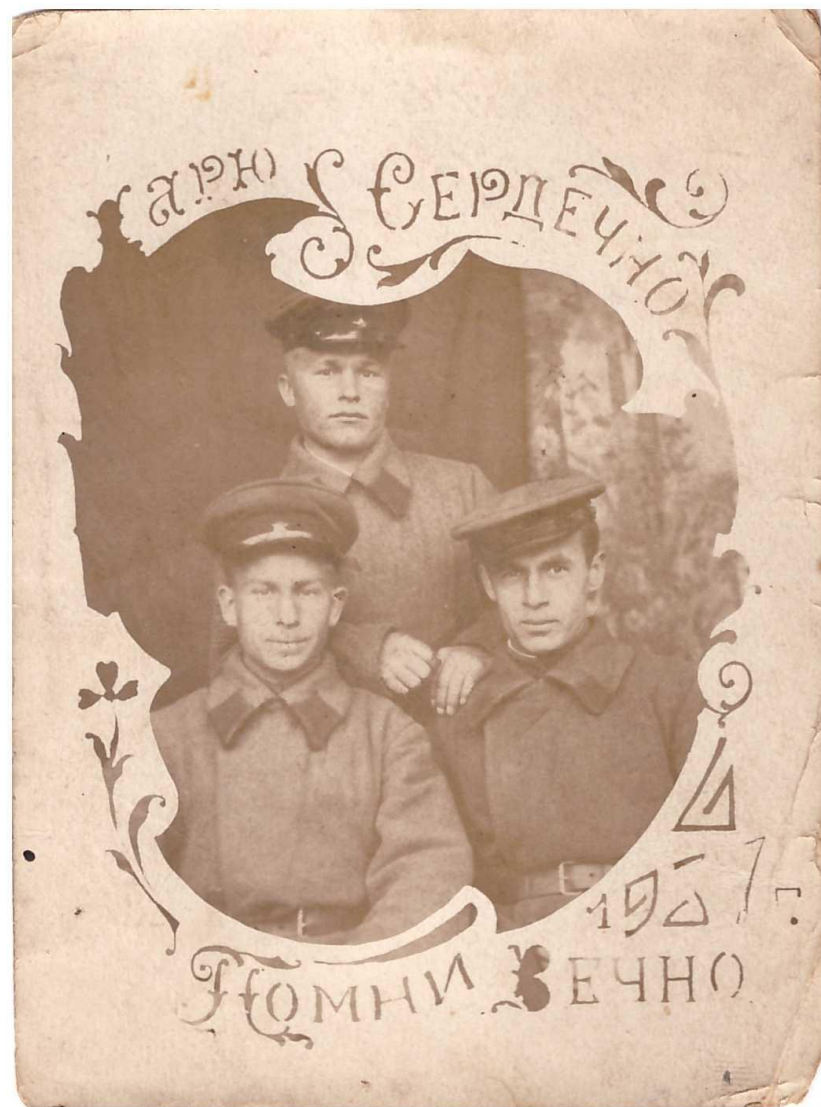
1927. ПОМНИ ВЕЧНО