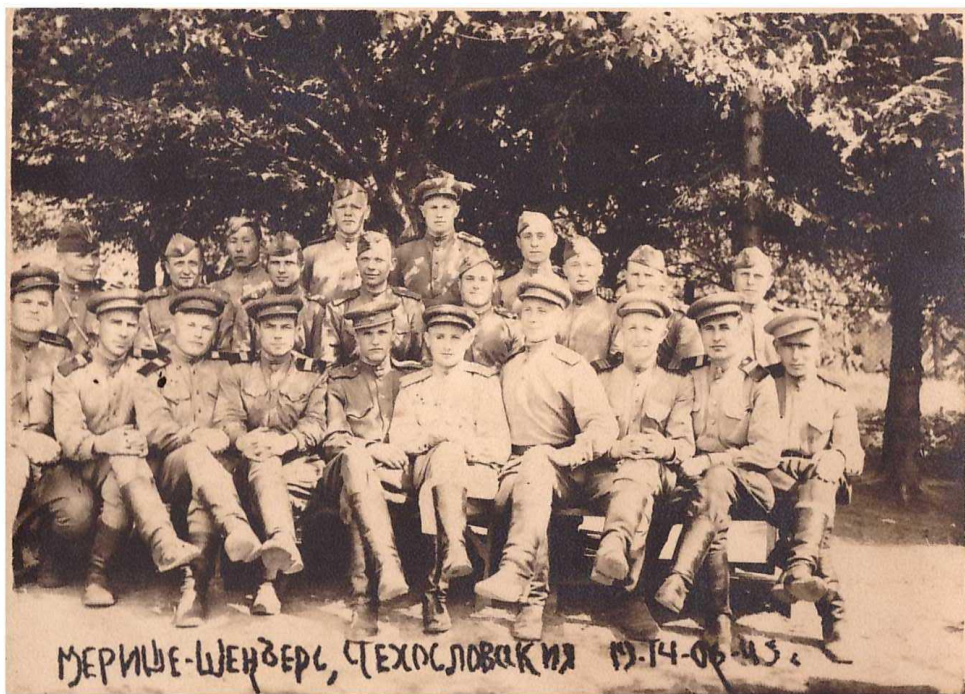
МЕРИШЕ-ШЕНДЕРС, СЕХОСЛОВАКИЯ 19-14-06-15.