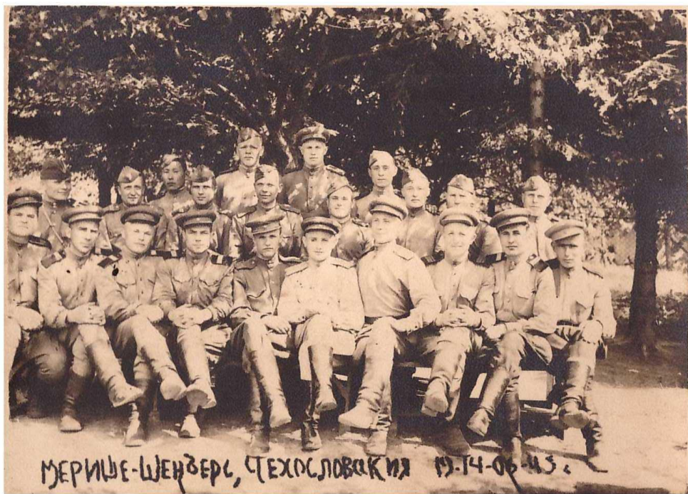
МЕРИШЕ-ШЕНДЕРС, СЕХОСЛОВАКИЯ 19.14.06.43.