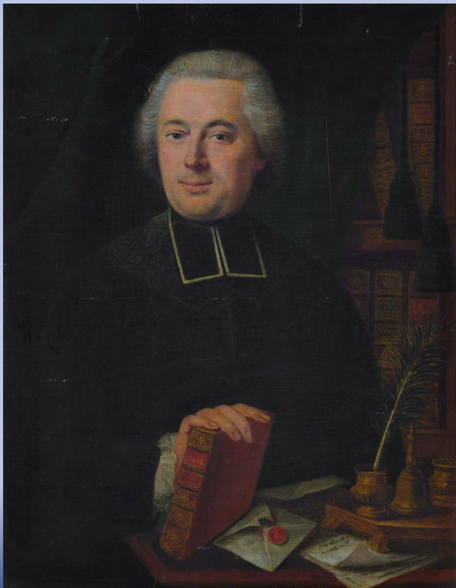
Антуан Франсуа Превó (аббат Превó)