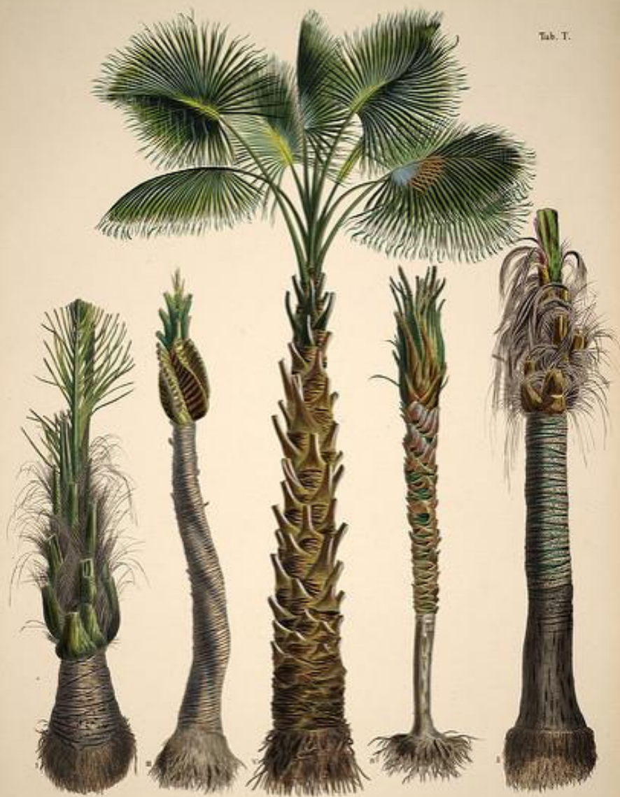
11. ATTALEA haudreni & COCOS cornuta & C. filizoplylla v. SABAL umbrosum liferum .