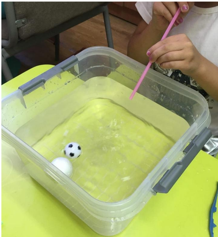
«Подуй на мяч»