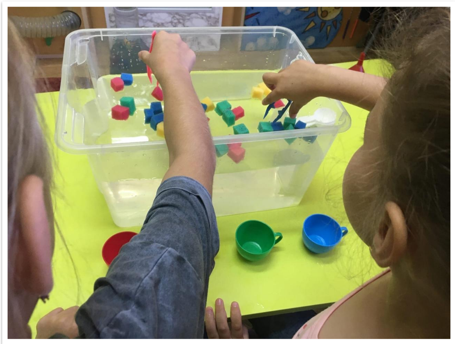
«Разложи губки по чашечкам»