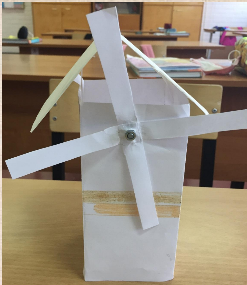
«Мельница Сампо»; бумага