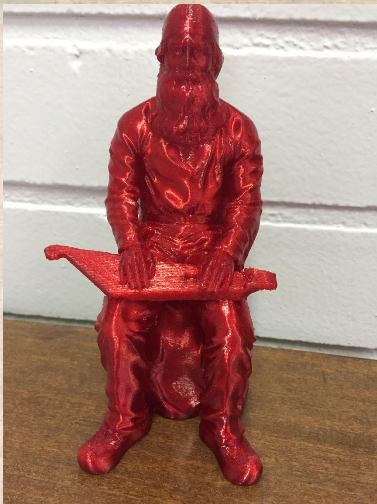
Битюков Эдик, 5 класс Вяйнемейнен; 3D принтер