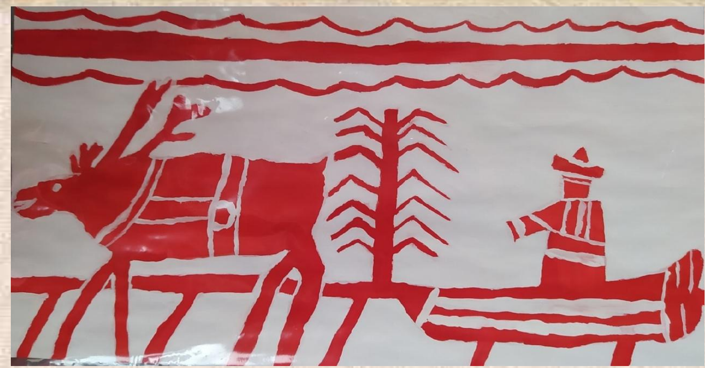
Орнамент по мотивам эпоса