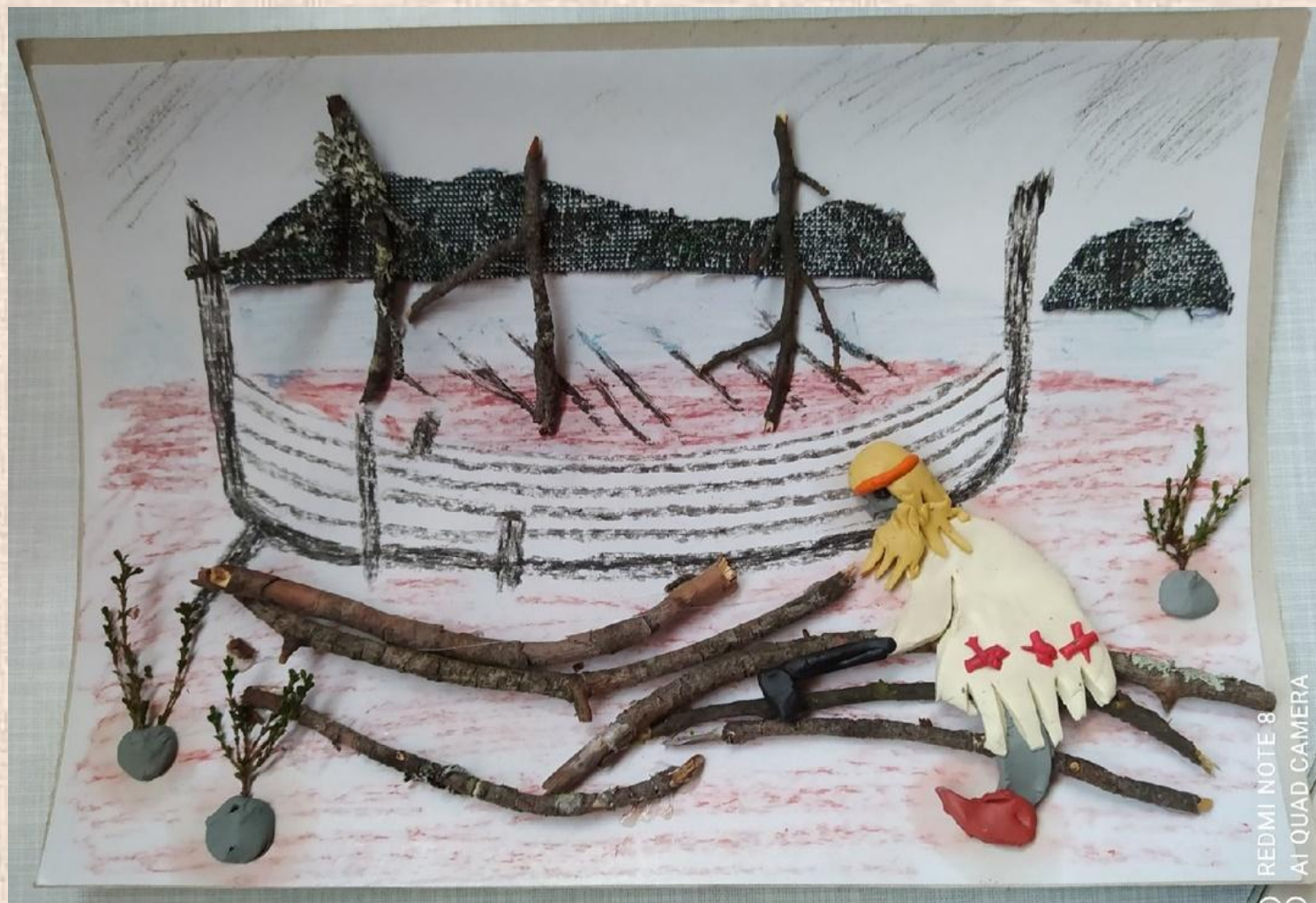
По мотивам эпоса; природный материал