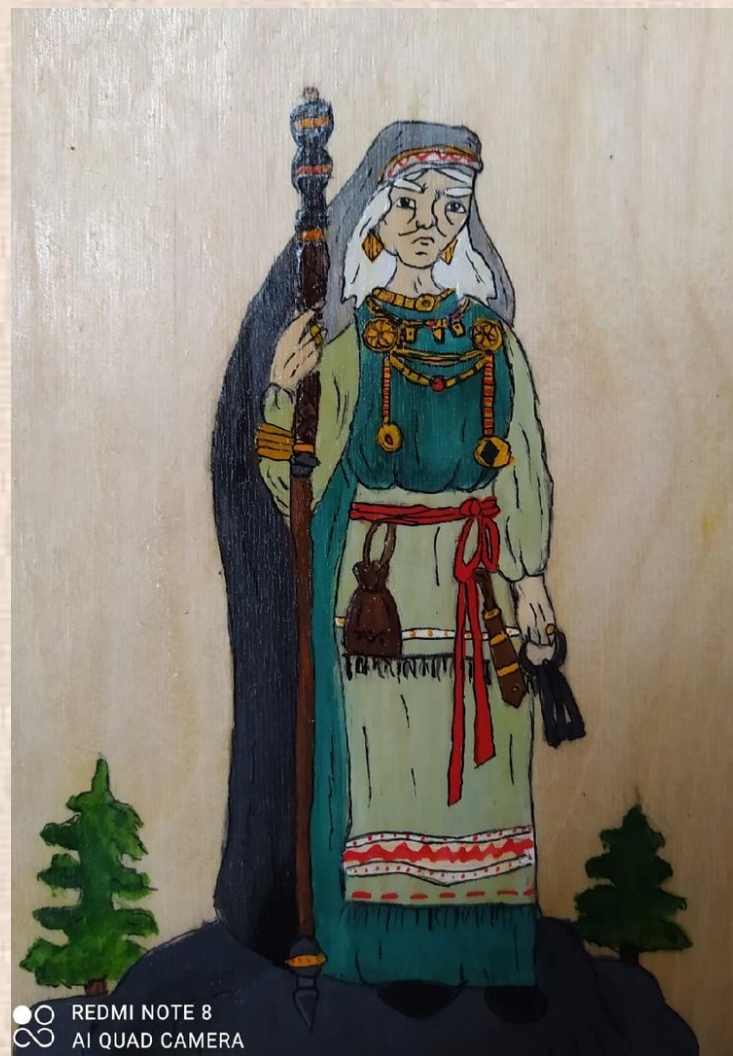
Вишнева Наина, 7 класс, «Старуха Лоухи»; рисунок на дереве (3 МЕСТО)