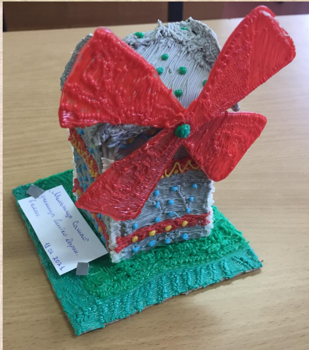
«Мельница Сампо»; 3D ручка