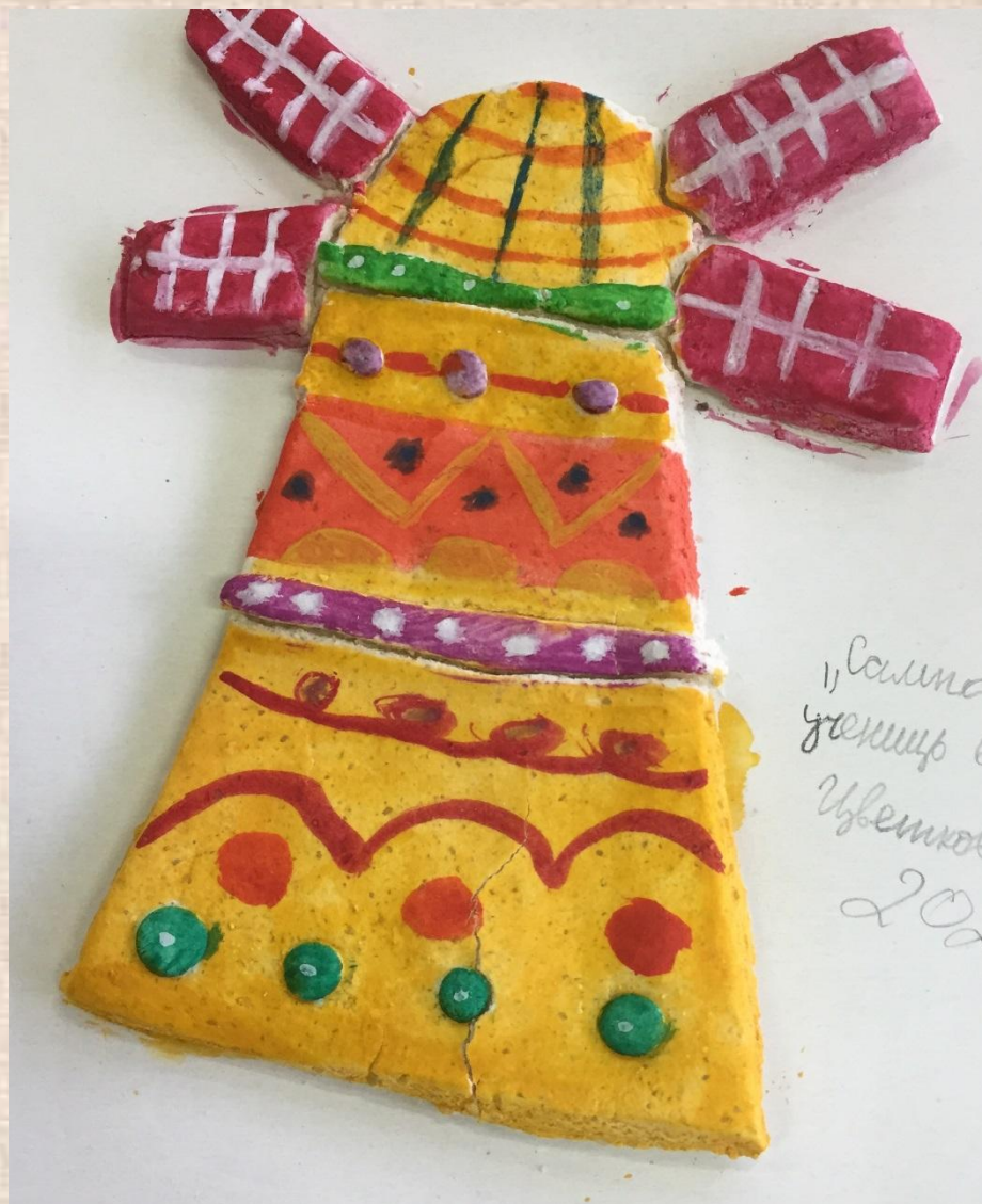
«Мельница Сампо»; солёное тесто