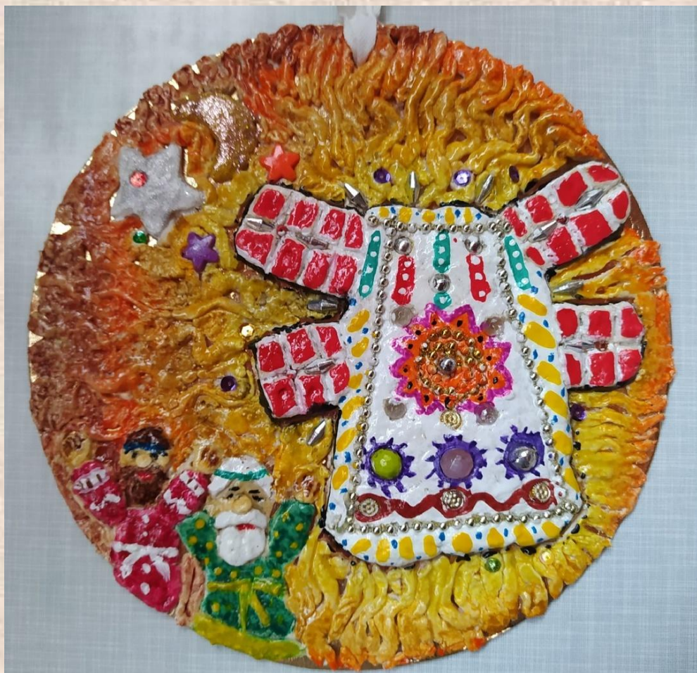
Леушка Денис, 7 класс Медальон «Мельница Сампо», солёное тесто (2 МЕСТО)