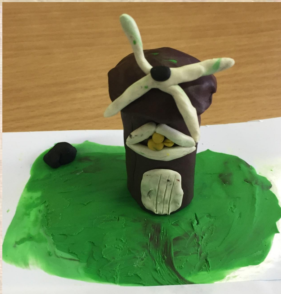
«Мельница Сампо»; пластилин